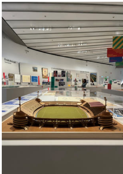
Alcune viste della mostra (ottobre 2025).

tici dell'Italia tra gli anni Settanta e Ottanta: quella sorta di messa laica rappresentata da Novantesimo Minuto , ideato, tra gli altri, da Paolo Valenti. La presenza di un time-lapse sulla realizzazione dell'Al Janoub Stadium (2019) e di nuclei di memorabilia e immagini d'archivio – ad esempio sullo stadio La Bombonera (1940) di Buenos Aires – esplicita l'intento di legare la storia progettuale all'immaginario collettivo e alla cultura visuale riferita allo sport. Tali scelte narrative che riattivano la memoria di eventi e gesti funzionano da controcampo all'iconografia dei modelli. L'insieme rende conto di come, nonostante la globalizzazione sfrenata, lo stadio sia comunque ancora percepito dal pubblico come un tempio laico e monumento rappresentativo di identità collettive. L'effetto, nel complesso, è quello di un palinsesto dove confronti cronologici e tipologici sono facilitati da scelte spaziali chiare, pur con qualche densità che talvolta potrebbe sovraccaricare di informazioni il pubblico non specialista. L'ex allenatore viareggino Eugenio Fascetti descriverebbe l'allestimento attraverso il sintagma binario, da lui stesso coniato, «caos organizzato». Il suo celebre Varese della stagione 1981-1982 era fondato sull'imprevedibilità, senza offrire mai troppi punti di riferimento agli avversari.