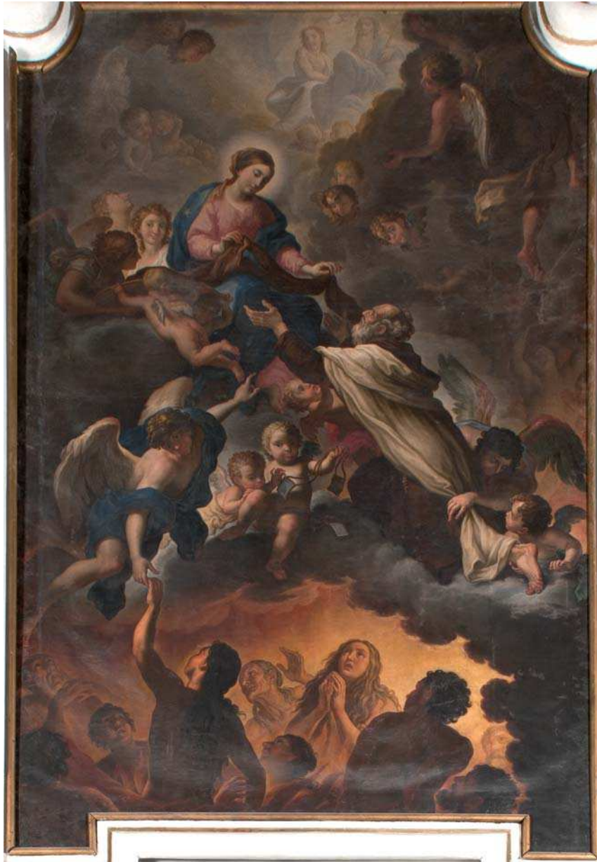
Fig. 1 - Gasparantonio Baroni Cavalcabò, La Madonna riceve lo scapolare dal beato Simone Stock , olio su tela, chiesa di Santa Maria del Carmine, Rovereto, tela centrale del coro.