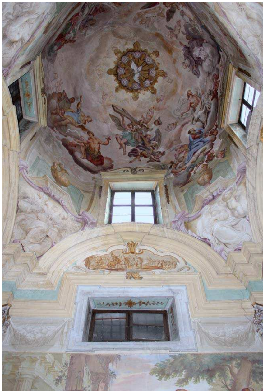
Fig. 6 - particolare della volta della cappella dedicata alla Beata Vergine di Caravaggio, Gasparantonio Baroni Cavalcabò ed Antonio Gresta, dipinto murale, chiesa di SS. Trinità, Sacco (Rovereto).