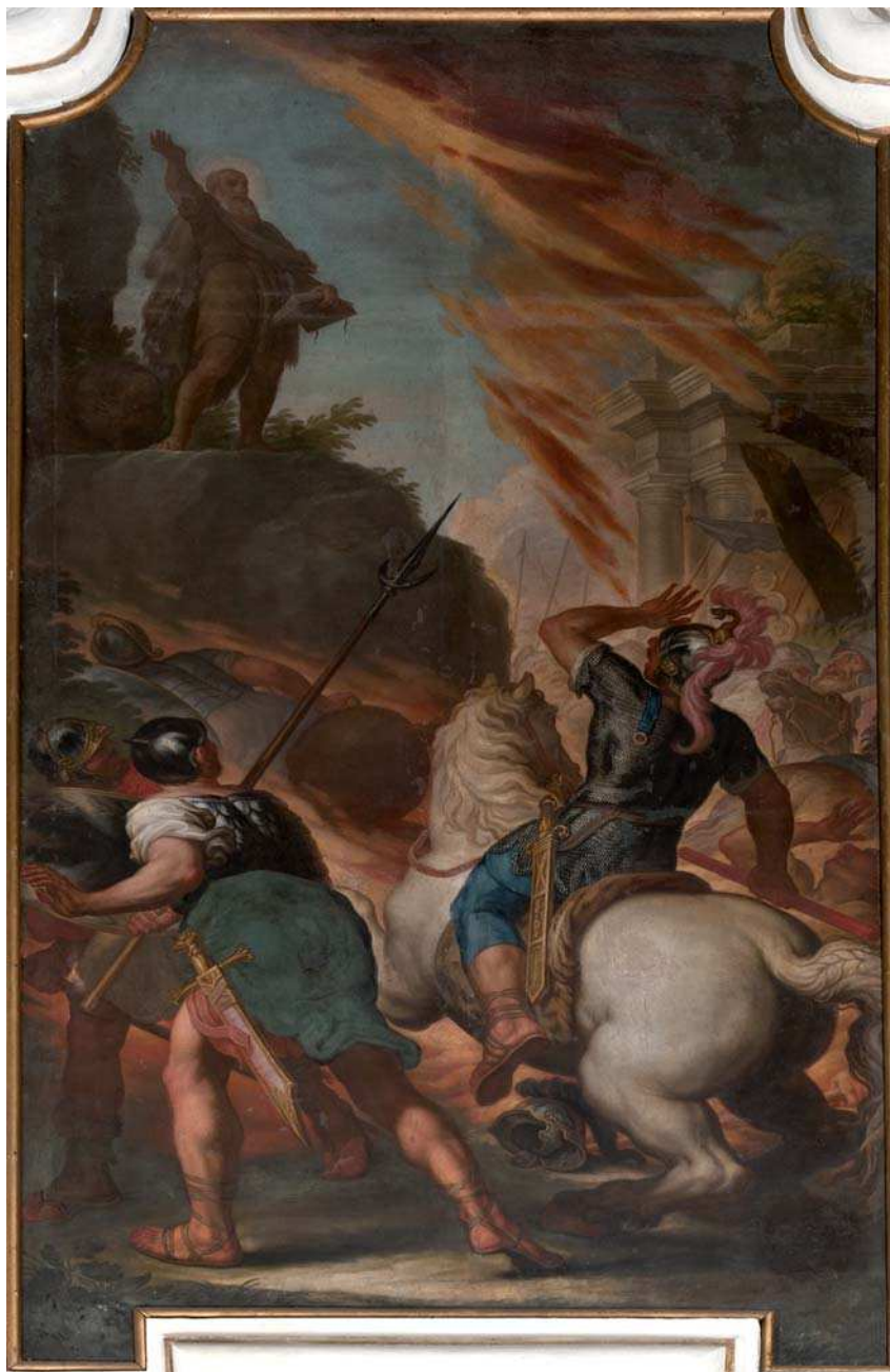
Fig. 2 - Gasparantonio Baroni Cavalcabò, Elia invoca il fulmine , olio su tela, chiesa di Santa Maria del Carmine, Rovereto, tela sinistra del coro.