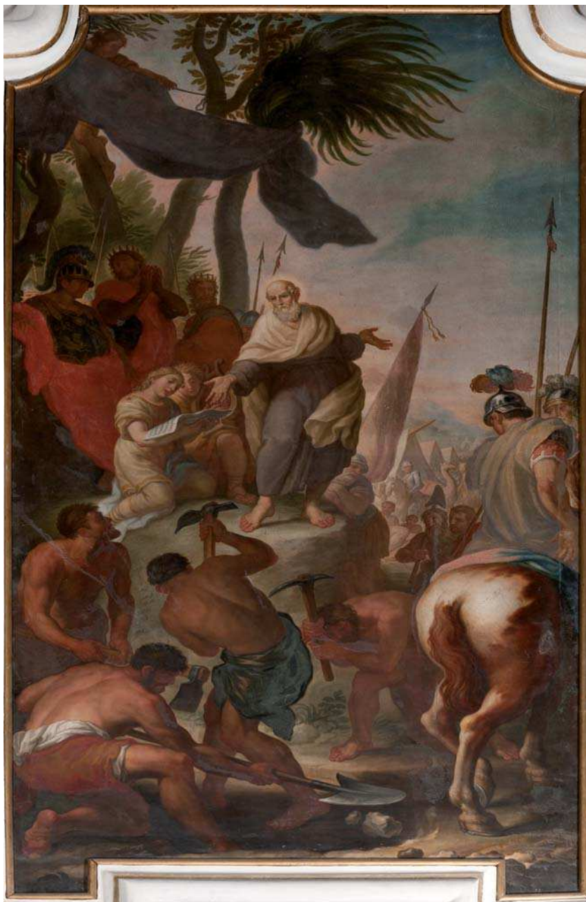
Fig. 3 - Gasparantonio Baroni Cavalcabò, Eliseo dona l'acqua a Josafat , olio su tela, chiesa di Santa Maria del Carmine, Rovereto, tela destra del coro.