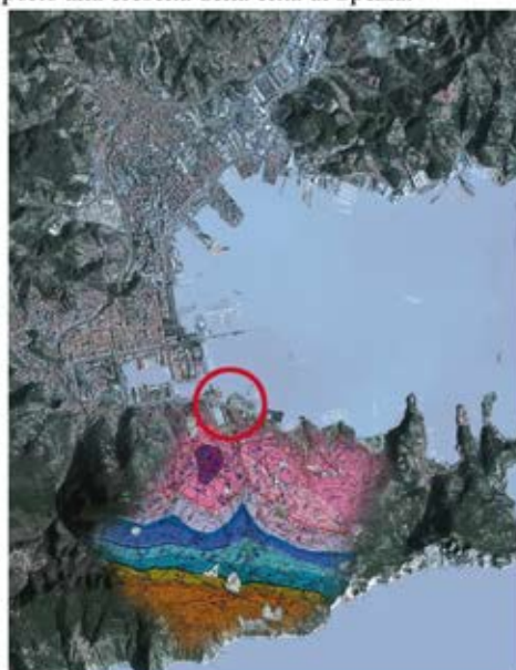
Fig.1-Particolare di inquadramento dell’area con indicazioni sull’assetto geologico del promontorio occidentale.

La nuova idea di Golfo come “macchina militare” richiese ingenti opere idrauliche ed infrastrutturali e cambiò letteralmente volto alla città incidendo profondamente la geomorfologia dei luoghi (Di Grazia, Marinaro, 2015) ed innescando, poi, una forte urbanizzazione che portò alla crescita della città di Spezia.