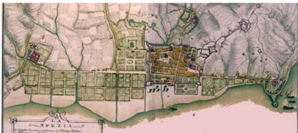
Fig. 2- M. Vinzoni. 1773. La Spezia. Particolare.

che localmente vengono chiamate "sprugole". Le sprugole sono il fenomeno risultante dalla struttura geomorfologica e composizione geologica del territorio. Le cavità ipogee e la forte fratturazione delle rocce sono condizioni che facilitano la circolazione delle acque sotterranee, la disposizione geometrica degli strati delle formazioni rocciose che immergono da sud verso nord, veicolano l'acqua piovana infiltrata nel versante del promontorio che scorrendo sotto terra in linee di flusso preferenziali emerge nella piana costiera sotto forma di sprugole, fuoriuscite di acqua dolce in pressione. Il fenomeno studiato fin dal 1600 dà luogo a piccoli laghetti se l'emergenza è in terraferma o a risalite di acqua dolce all'interno del golfo (polle) quando il fenomeno è sottomarino, oltre la linea di costa. Nell'area è presente lo sprugolotto Cozzani, la sprugola a tutt'oggi presente nell'arsenale e la polla di Cadimare. Si può notare la presenza della Sprugola dell'arsenale e dello sprugolotto Cozzani nell'antica carta di Matteo Vinzoni, indicati come "stagno".