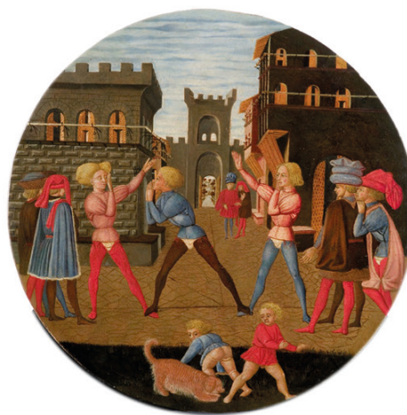
Fig. 2 G. di Ser Giovanni Guidi, Gioco del Civettino , Desco da Parto, 1450 (Palazzo Davanzati, Firenze)

le evoluzioni della disciplina pedagogica, la quale privilegia la sperimentazione e l'azione creativa e promuove l'integrazione delle pratiche ludiche nell'ambiente urbano 2 .