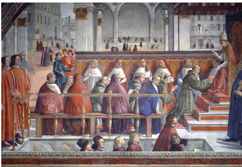
Fig. 1 D. Ghirlandaio, La conferma della regola , Affresco 1479 - 1485 (Cappella Sassetti, Chiesa di Santa Trinita, Firenze).