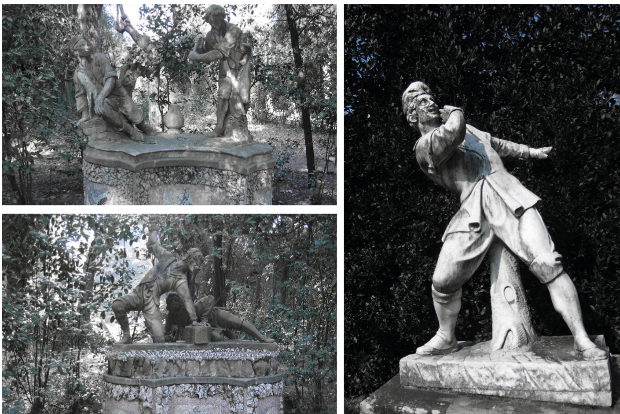
Fig. 3 Giochi nel Giardino di Boboli. In senso orario:

G. B. Capezzoli, Gioco della pentolaccia , gruppo scultoreo, 1778-1780, Giardino di Boboli, Firenze