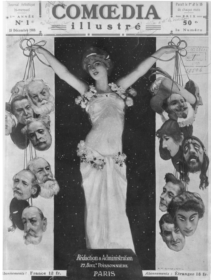
Fig. 1. Comœdia Illustré», 1 ère année, n. 1 (hors-série), 15 décembre 1908.

1908, afin de donner à nos lecteurs et abonnés un compte-rendu rapide et succinct du commencement de la saison dramatique (l'année théâtrale commençant non le 1 er janvier, mais le 15 octobre de chaque année).