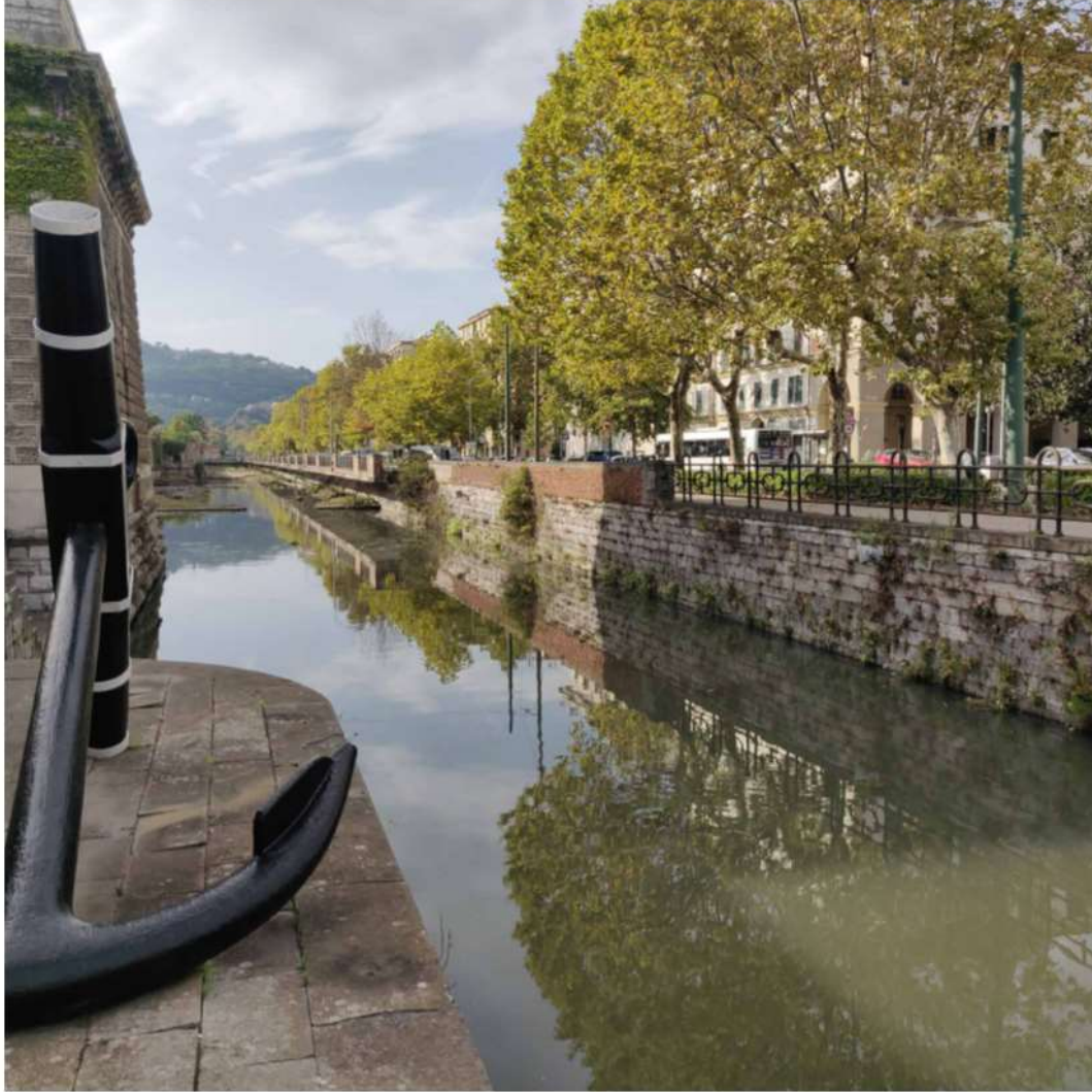
Fig. 3 - L'effervescenza della soglia. Lagora, ex torrente oggi canale.