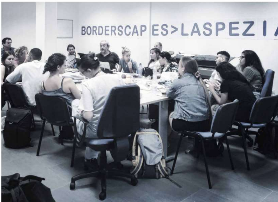
Fig. 1 – BORDERSCAPE. Istantanea dal laboratorio.