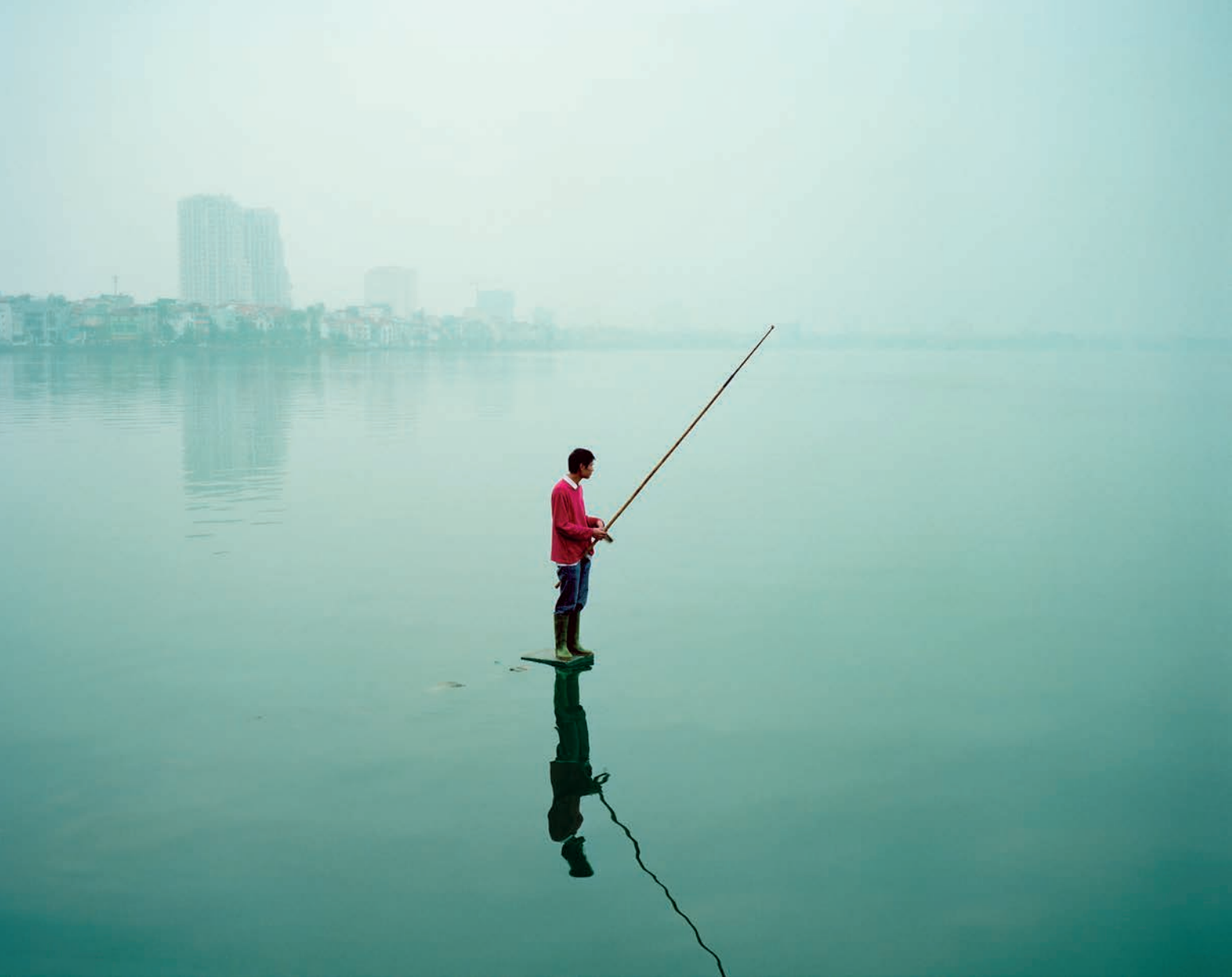
Greg Girard, Man in Red Sweater Fishing , Hanoi, 2010.