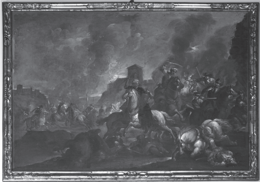
65. Anonimo veneto, Battaglia tra cavalieri . Rovereto, palazzo Bossi Fedrigotti.

Bologna dal Cignani, dove fu accompagnato dallo stesso Calza. Nel 1686, quando Cignani si era già trasferito a Forlì, Marchesini tornò a Verona, dove rimase fino al primo Settecento: un'informazione invero molto confortante 22 .