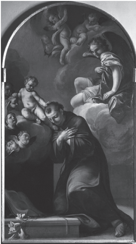
70. Alessandro Marchesini, Sant'Antonio da Padova con Bambino . Marcellise (VR), chiesa di San Pietro.