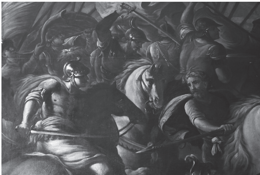
64. Anonimo veneto, Giosuè che combatte gli Amaleciti . Rovereto, palazzo Bossi Fedrigotti (particolare).

di Vannetti, che riporta alcune interessanti notizie relative alla sua formazione: questa sarebbe avvenuta a Verona, presumibilmente negli anni '90 del Seicento e presso due pittori veronesi, ovvero Antonio Calza e Alessandro Marchesini. La prima questione da affrontare riguarda la presenza o meno dei due artisti in città nel periodo indicato. Se per Antonio Calza non ci sono informazioni dettagliate ad annum (si formò con Carlo Cignani a Bologna e nel 1675 andò a Roma, per poi tornare a Bologna ma da allora non abbiamo informazioni precise fino al primo Settecento) 21 , più rassicuranti sono le notizie desumibili dalla biografia di Alessandro Marchesini. Questi, nato nel 1663, a dodici anni entrò nella bottega di Biagio Falcieri e nel 1680 andò a