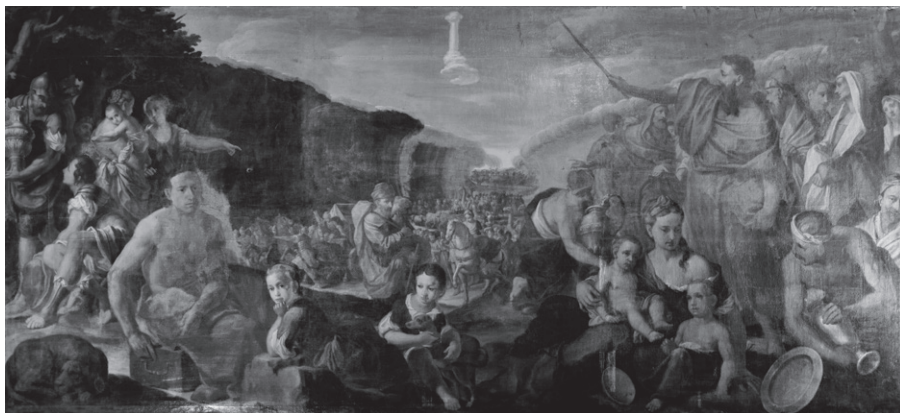
66. Secondo Maestro delle Storie di Mosè, Passaggio del Mar Rosso , 1730 circa. Rovereto, palazzo Betta-Grillo.

circa 34 . Una cronologia molto simile quindi alle tele del palazzo di Sacco, da cui però si distaccano stilisticamente. Il Secondo maestro delle storie di Mosè è un pittore che manifesta una formazione e un linguaggio veneto (fig. 66): i profili femminili, coi nasi appuntiti e accesi da tocchi di colore rosso, così le mani affusolate e i toni pastello sembrano debitori dello stile che Antonio Balestra portò a Verona nel primo Settecento dopo i viaggi di formazione a Roma e in Lombardia. Un pittore molto diverso rispetto al collega attivo per i Bossi Fedrigotti. Una tale conoscenza delle opere di Balestra spinge ad escludere la lectio facilior , cioè che questo artista sia il Giovanni vannettiano, a meno che non si prospetti un secondo soggiorno veronese o veneziano nel primo Settecento. Eventualità probabile, ma non documentata. Tuttavia, l'alto livello pittorico dell'artista qui presentato e, d'altra parte, l'assenza di altre sue opere nel medesimo territorio spingono a credere che il Secondo maestro di palazzo Betta-Grillo sia un pittore veronese di passaggio a Rovereto, anche se ad oggi non è possibile individuare un nome preciso. Della stessa mano sono inoltre, sempre nel medesimo palazzo, tre dei quattro ritratti di esponenti della famiglia Betta esposti nella Sala dei ritratti del medesimo piano. Si tratta dei ritratti post mortem di Felice Betta (1631-1713, fig. 67) e Carlo