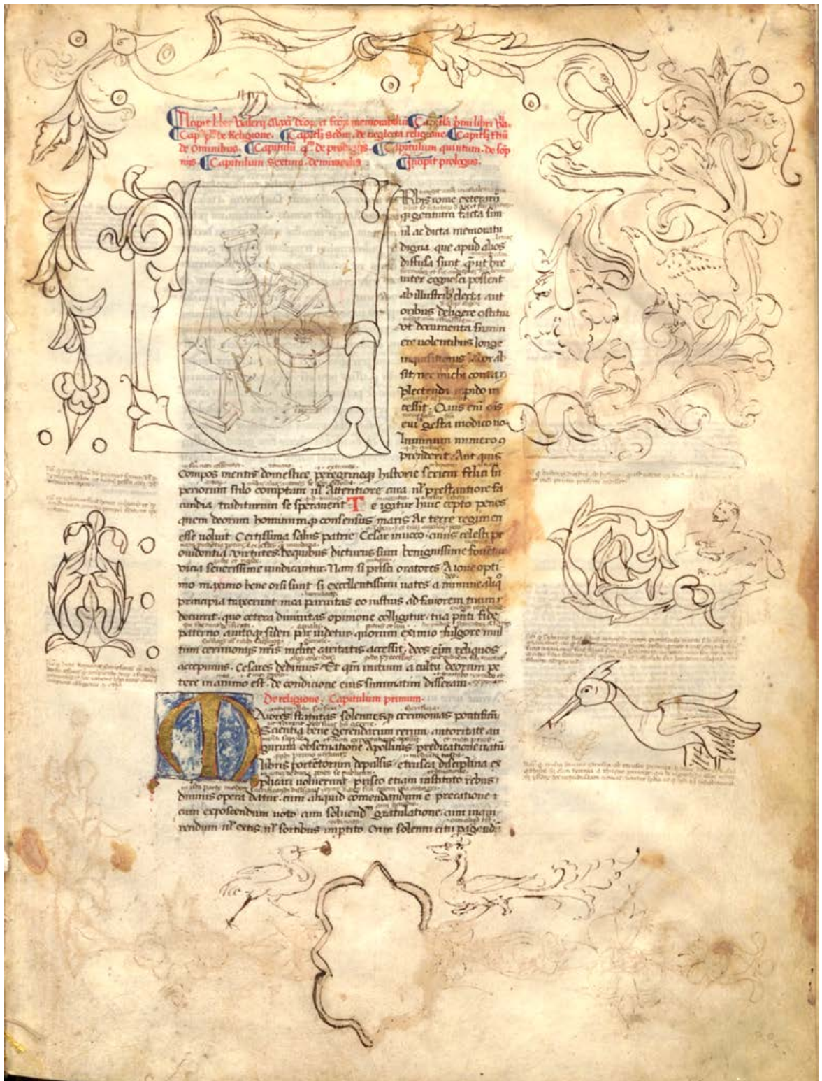
180a. Milano, Biblioteca Ambrosiana, H. 25. Inf. (f. 1r)