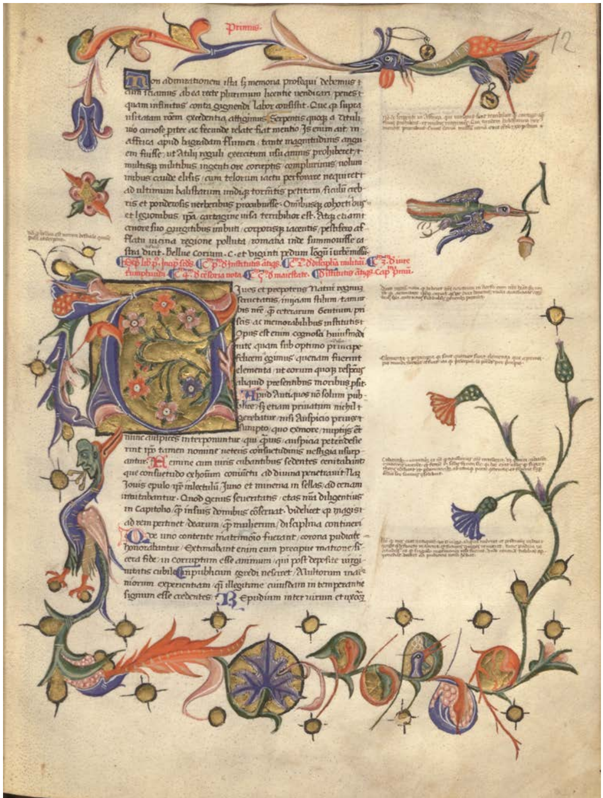
180b. Milano, Biblioteca Ambrosiana, H. 25. Inf. (f. 12r)