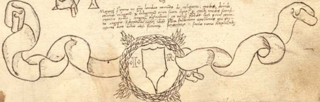
174. Milano, Biblioteca Ambrosiana, B. 158. Sup. (f. 5r)