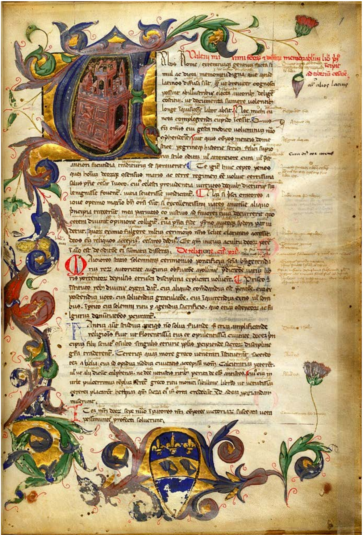
157a. London, British Library, Arundel 7 (f. 1r)