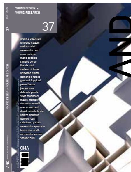
in copertina/cover: Dettaglio del "Centraal Beheer" di Herman Hertzberger, Apeldoorn 1972 / Detail of the "Centraal Beheer" by Herman Hertzberger, Apeldoorn 1972.

La rivista non è responsabile per il materiale inviato non richiesto espressamente dalla redazione. Il materiale inviato, salvo diverso accordo, non verrà restituito.