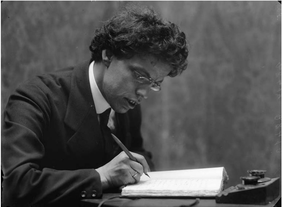
Giovanni Papini (1913)