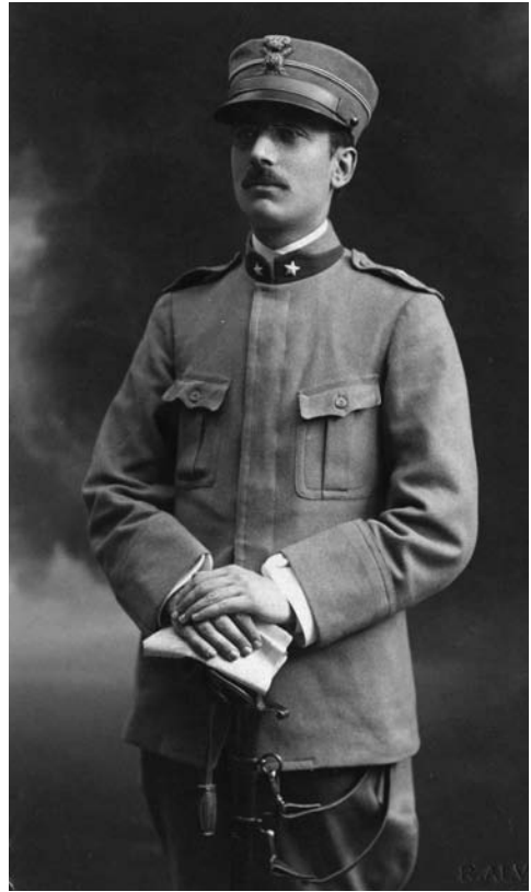
Giuseppe Prezzolini, FPC.

Del metodo storico sorridono o ridono volentieri oggiogiorno i geniali giovinetti o giovinotti italiani [...]. L'analfabetismo italiano, temendo di morire (ma c'è tempo!), ha inventato la genialità, per prolungarsi la vita; ha contrapposto con graziosa e commovente fatuità l'arte (ahi, la frigida e fabbricata arte dei nostri poetini giovani!) alla scienza; ha acceso nel cuore e sulla bocca di critici e poeti i razzi artificiali degli entusiasmi artistici. E, inoltre, di una grande, purtroppo mal giustificata, albagia. [...] Ciononostante, gli eruditi e i filologi, senza darsi pensiero di questo nuovo furibondo accademismo delle persone geniali [...] continuano nell'opera loro, assidua, tranquilla e modesta, intenta a render la nostra scienza più capace di misurarsi con la scienza straniera, e a dotar l'Italia largamente di quell'alta cultura di cui ancora non possiede se non brandelli, ma di cui ha necessità se vuol tenere il suo posto nel mondo [...]. Ma già nel passato [...] il movimento e rinnovamento di studii, a cui si usa dare il nome di «metodo storico» fu [...] un innalzamento morale, perché «metodo storico» anzitutto, se significa qualche cosa, non significa le sciocche cose che i pedanti della genialità gli attribuiscono, ma ricerca sincera e spassionata di verità, fatta col massimo sforzo d'intelligenza insieme e di pazienza, cioè di volontà; significa tutto insieme scienza e coscienza.