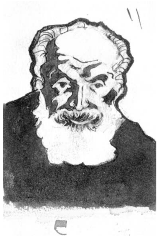
Girolamo Vitelli, disegno di Carlo Michelstaedter

De Robertis di Vitelli e dell'Istituto era però stato davvero un allievo ed è questo che in primo luogo sembra fare la differenza. Le posizioni di quei giovani intellettuali, anche quelli vicini alle riviste fiorentine, che l'Istituto lo frequentano da studenti, divergono tutte sensibilmente dalle bordate di Prezzolini e Papini, pur non risparmiando talvolta critiche e riserve: «Noi studenti dell'Istituto