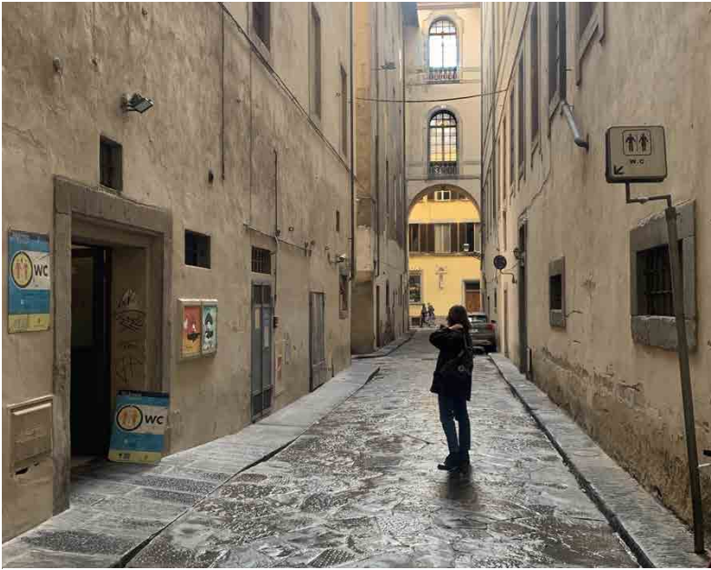
Fig. 4 Bagno pubblico in Via Filippina a Firenze, 2022

Inoltre, non esiste un'immagine d'insieme: ogni struttura ha un suo linguaggio e rapporto col contesto, il che determina la difficoltà nell'individuare un sistema comune.