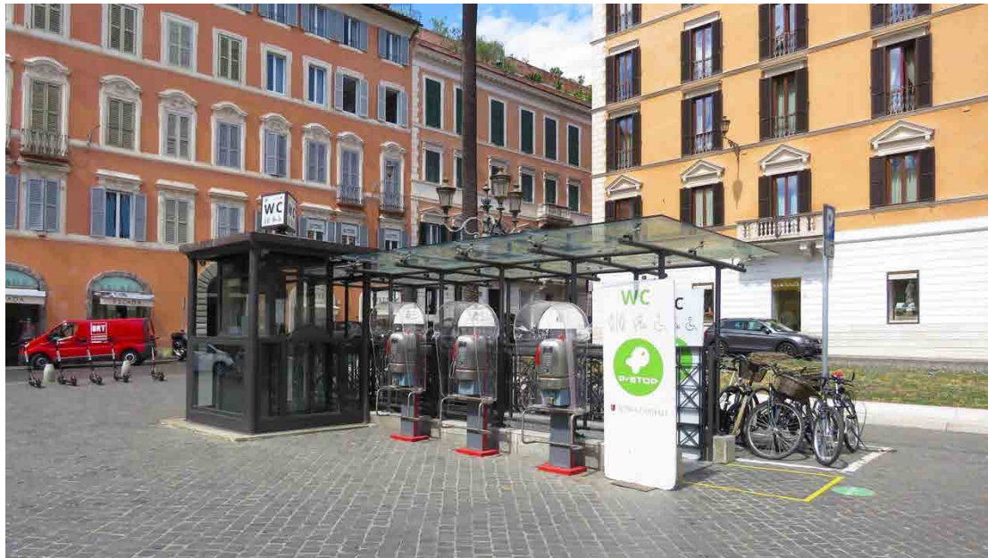
Fig. 3 Bagni pubblici in Piazza di Spagna a Roma Progetto SDI Group, 2019

qualificante , si evince la complessità del combinare gli elementi caratterizzati da forme, materiali, colori e modalità di fruizione del cittadino 6 . Emerge la criticità del tabù che cancella i servizi igienici dall'elenco dei parametri di monitoraggio per gli spazi pubblici del Piano di Gestione del Centro Storico di Firenze, che è lo strumento necessario all'amministrazione per mantenere lo status di patrimonio UNESCO. Vi è un riferimento solo nella parte relativa ai WC offerti dai musei. L'effetto è quello di confermare l'immagine di città-museo che Amendola definisce «A Florence in which the city of tourists is oppressing the city of the residents» 7 .