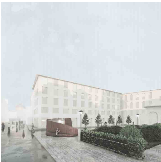
Fig. 5 Inserimento della proposta progettuale in Piazza dei Ciompi a Firenze, 2022