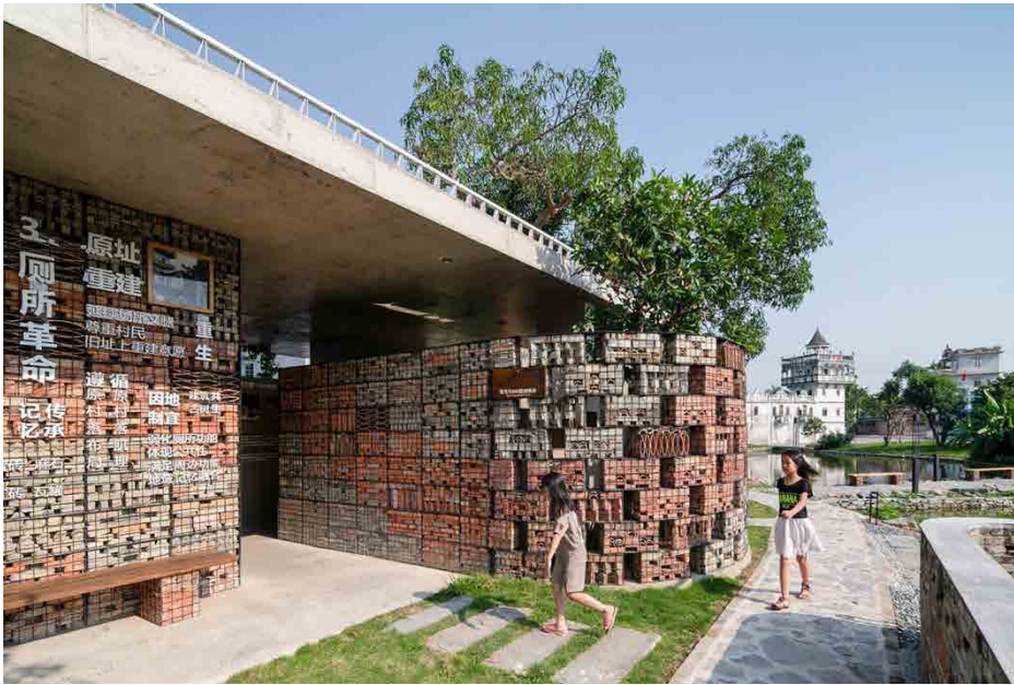
Fig. 2 Bagno pubblico a Zuzhai village progettato dallo studio cnS, 2019

dell'immagine della società contemporanea.