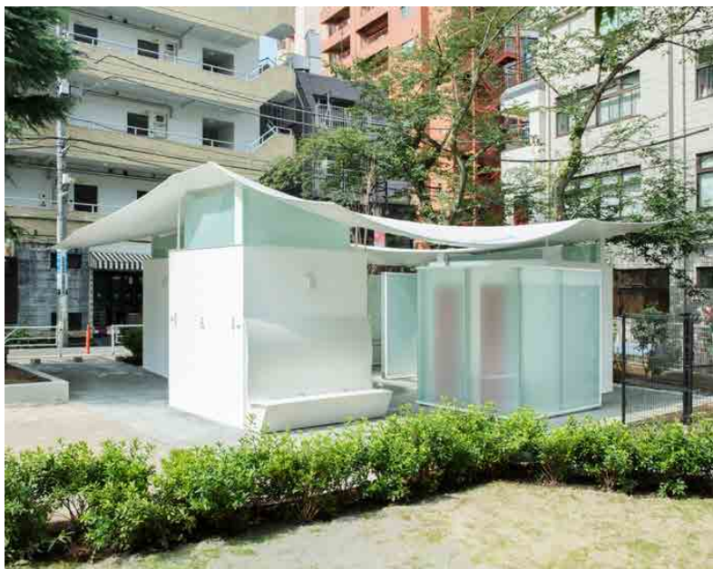
Fig. 1 Bagno pubblico a Ebisu East Park progettato da F. Maki a Tokio, 2020

pubblica e alle terme romane, quando salute e igiene erano parte della cultura. La storia ha accompagnato l'evoluzione del servizio igienico nel contesto pubblico e privato con innovazioni idrauliche sui sistemi fognari e sanitari. Nella casa contemporanea il bagno è interessato da effervescenza creativa e ricercatezza, trasformandolo in un vero e proprio status symbol: dal doppio servizio alle camere con bagno dedicato, fino agli accessori per il wellness. Lo stesso servizio quando diventa pubblico deve fare i conti con l'assenza di progettualità generando volumi insignificanti, capaci di determinare fenomeni di incuria, degrado e scontro sociale. Occorre reinventare la città come luogo democratico, etico ed estetico, a partire dal progetto di un servizio per tutti denso di decisioni e significati. Per il sociologo Harvey Molotch 3 i bagni pubblici sono lo specchio della società: occorre integrare nuove strategie nella politica urbana. Con il demolire il tabù che considera il servizio igienico pubblico un apparecchio tecnologico scomodo e problematico, soprattutto nel contesto urbano storico, si può riscoprire il suo impatto positivo sulle persone così come sulla città. La qualità della vita offerta da una città passa dal grado di accessibilità che riesce a offrire, un concetto che il sociologo Giampaolo Nuvolati sostanzia non solo come offerta di servizi, ma anche come capacità dei singoli di sfruttarne l'esistenza 4 .