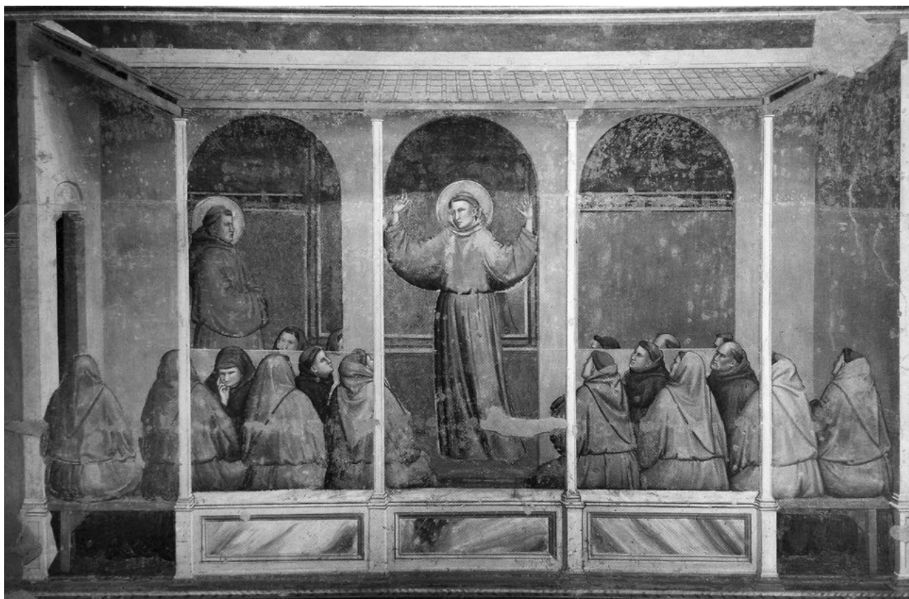
Fig. 4 - Firenze, chiesa di S. Croce, cappella Bardi: Giotto, L'apparizione in Arles a sant'Antonio che predica. La straordinaria sezione verticale (1325 circa) mette in vista la struttura di copertura del chiostro con il manto in coppi ed embrici adagiato su di un tavolato di assi appoggiate a una doppia orditura di travicelli e travi lignee.

alle generiche attestazioni di tegole, vengono ricordati gli embrici 112 , i comignoli 113 , le docce 114 , i coppi 115 o bottacci 116 , i tegoli e le gronde 117 . Purtroppo mancano dati sulle dimensioni e le forme di questi elementi, la cui terminologia è solo in parte simile a quella corrente, e dunque restano necessari riscontri archeologici più precisi.