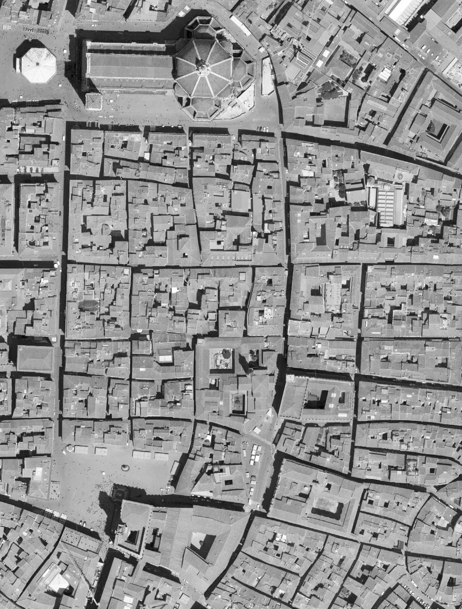
La struttura urbana del centro di Firenze, porzione di foto aerea.