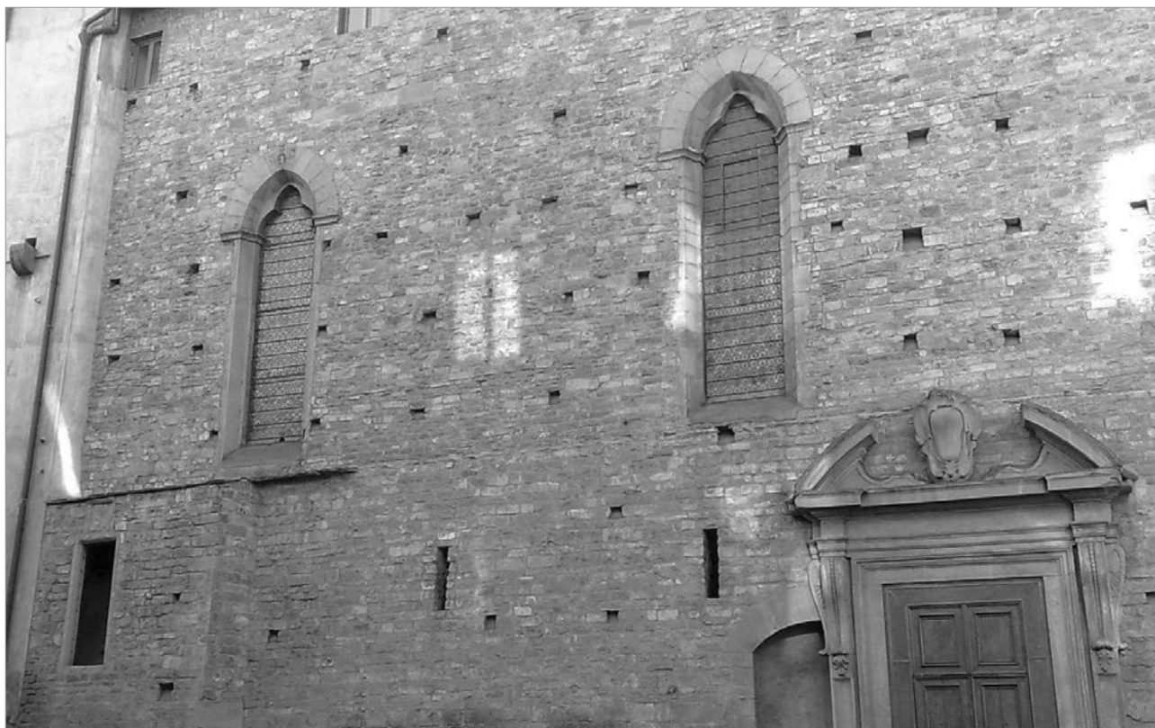
Fig. 1- Firenze, chiesa di S. Maria Maggiore, fianco nord. Si notano le tracce del manto di copertura a lastre lapidee della navata romanica sinistra.

graficamente i possedimenti dei Baldovinetti nel 1384 si descrive una bottega sotto la torre del Leone con la sua tettoia o copertura a scaglie (scandole o, più probabilmente, lastre) 46 .