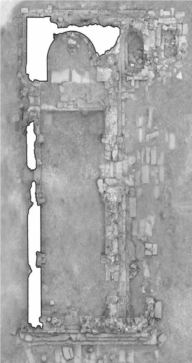
Fig. 3 Chiesa di Khumarajam a Gami, Armenia. Planimetria. L'elaborato è stato realizzato dall'autore e dal gruppo di ricerca del Dipartimento di Architettura di Firenze, a partire dai rilievi sul sito condotti dagli stessi nel mese di giugno 2022.