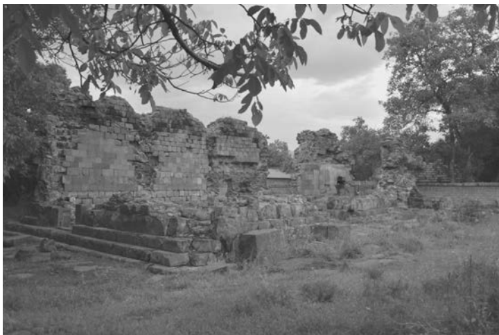
Fig. 1 Chiesa di Khumarajam a Garni, Armenia. Vista dall'angolo sud-ovest. Foto dell'autore, giugno 2022.

2007, p. 55; 1994, p. 62), o abbinando la tipologia architettonica “ église à nef unique de Garni ” (Hasratian 1978). Nelle ricerche italiane si legge: “basilica di Garni” (Breccia Fratadocchi et al. 1968), “chiesa nel villaggio di Garni” (Gandolfo 1973), “chiesa a navata semplice” (Gandolfo 1973). Paolo Cuneo la indica come “Garni, chiesa a sala” (1988).