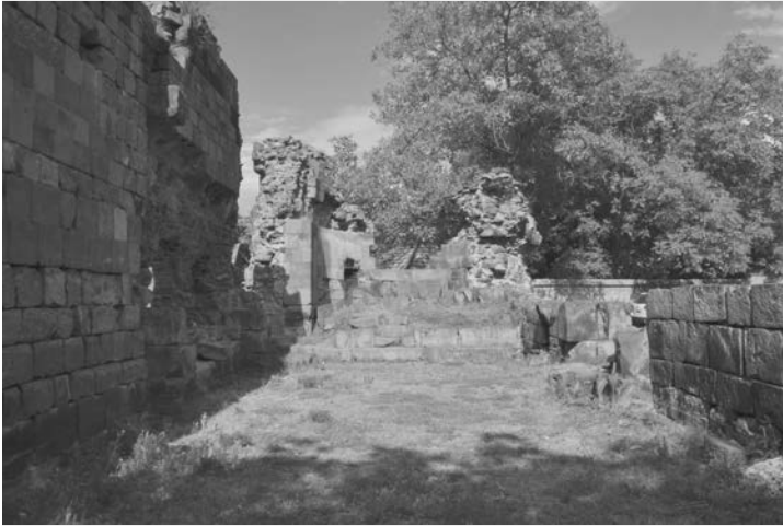
Fig. 2 Chiesa di Khumarajam a Garni, Armenia. Vista dell'interno verso l'abside ad est. Foto dell'autore, giugno 2022.

e ricostruire la storia del monumento, il quale manifesta una complessiva incoerenza costruttiva. Il lavoro riordina gli eventi che hanno portato la chiesa alla conformazione attuale. Il quadro che ne emerge riconosce almeno fasi quattro distinte: la prima costruzione del IV secolo; la seconda fase, ovvero la prima trasformazione, del VI secolo con cui si aggiungono il portico a Sud e la cappella absidata; la terza fase del XIII secolo con cui si attua un rifacimento quasi totale dell'edificio, restaurando il portico ed i muri laterali, ed infine la quarta fase, collocata nei primi decenni del XVII secolo, con cui si interviene nell'apertura della porta sul fronte Ovest.