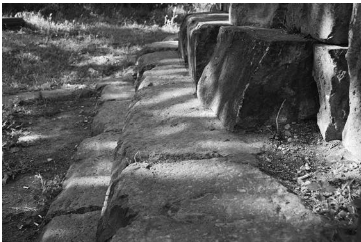
Fig. 5 Chiesa di Khumarajam a Garni, Armenia. Fotografia di dettaglio dei tre gradini della piattaforma basamentale di fondazione, o crepidine, in cui si nota la presenza del tracciato inciso di progetto, icnografia.

della storia e degli eventi trascorsi, il monumento ne è il primo dei testimoni e custode del valore sia materiale che immateriale. La chiesa di Garni, così evidentemente oggetto di trasformazioni, è esemplificativa di quanto il monumento architettonico sia una fonte storica primaria da consultare ed indagare, rivelatore e testimonianza fisica degli eventi. Per tale motivo il monumento deve essere indagato con precisione, e le osservazioni architettoniche ed archeologiche devono essere contestualizzate da un punto di vista territoriale e storico, aprendosi a connessioni culturali ad ampia scala. Le sole rappresentazioni schematiche utilizzate nello scorso secolo non possono essere utilizzate per studi di approfondimento, ma rimangono come testimonianza di una corrente di pensiero dell'epoca che inquadrava la ricerca dell'architettura armena all'interno di classificazioni tipologiche. Nel connubio 'monumento/documento' è custodita un'eredità, da leggere e raccontare. Il caso di Garni è esemplificativo di questo, e per tanto va letto come lente di una storia di trasformatio-