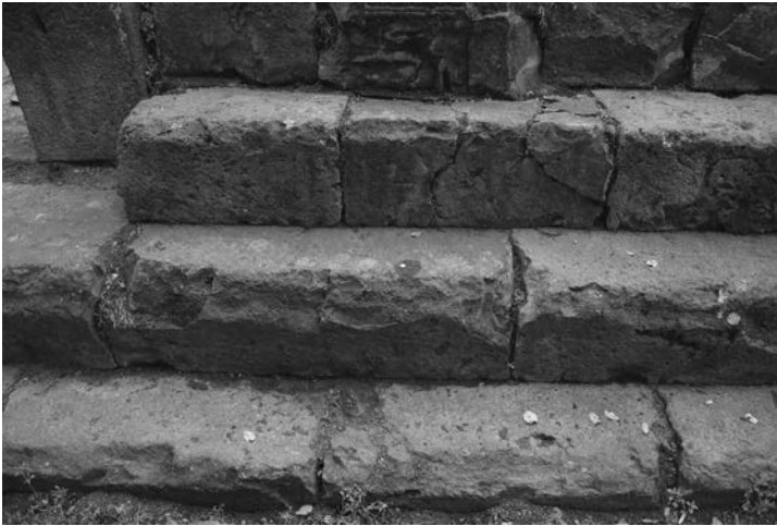
Fig. 4 Chiesa di Khumarajam a Garni, Armenia. Fotografia di dettaglio dei tre gradini della piattaforma basamentale di fondazione, o crepidine, in cui si nota l'alternanza bicroma dei conci e le loro grandi dimensioni. Fotografia dell'autore, 2022.

al catholicos si costituisce in strutture chiuse legate alle famiglie reali. Se si considera poi la valenza storica della città di Garni che già in periodo romano acquista un ruolo strategico-militare e che perpetua una funzione di preminenza nel periodo tardo, diventando sede vescovile e reale sotto la dinastia arsacide alla metà del IV secolo (Gandolfo 1973, p. 30), potremmo spingerci nell'ipotesi di un'appartenenza a quei sistemi: prima classico-romano, precedente al IV secolo (Helly, Rideaud 2021, p. 79), e poi vescovile-reale, con la funzione di chiesa di periodo tardoantico post IV secolo.