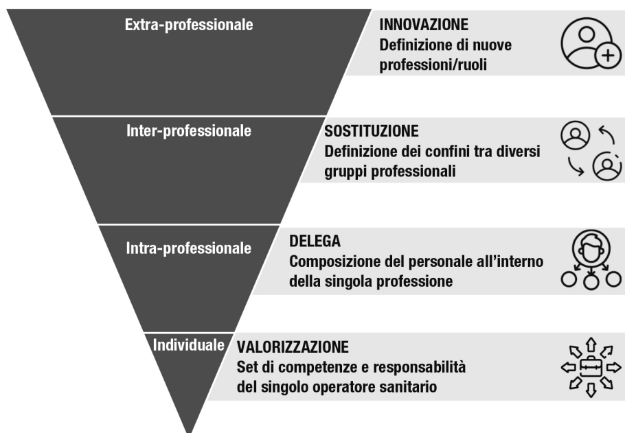
Figura 14.1 Strategie di skill-mix change

Una prima forma di skill-mix è rappresentata dalla possibilità di arricchire le mansioni svolte da una specifica categoria professionale (“ enhancement ”, valorizzazione), incrementandone il livello di responsabilità e autonomia nello