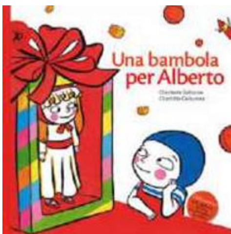
Zolotow, Charlotte, Delacroix, Clothilde. Una bambola per Alberto . Giralangolo (Sottosopra), 2014

Protagonista della storia è Tito, un lupo che da grande vorrebbe fare il fioraio che deve lottare contro le aspirazioni paterne che, invece, lo vorrebbero indirizzare verso il mondo della caccia. La narrazione si inserisce lungo due poli oppositivi rispetto al ruolo di genere del protagonista, dato che da un lato ci sono le idee del padre (e della società) che spingono Tito a conformarsi con la tradizione del suo lignaggio maschile, e dall'altra le aspirazioni di Tito che, invece, lo conducono verso “professioni” che sfidano la tradizione maschile.