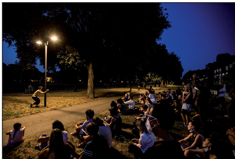
Fig. 4. Performance Lampione Diario Isolotto nel Lungarno dei Pioppi .

effettuate interviste in due tempi diversi: interviste libere in una prima fase (giugno-luglio 2021) e semi-strutturate in una seconda (marzo-aprile 2022).