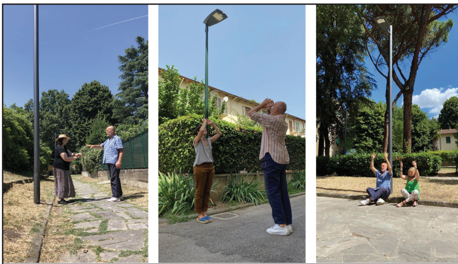
Fig. 3. Da sinistra a destra: prove della performance Lampione Diario Isolotto in piazza dei Tigli, nei pressi di via Torcicoda, nel viale dei Bambini.

Nel caso di Lampione Diario Isolotto , si è chiesto ai partecipanti di descrivere attraverso il corpo e il gesto il proprio itinerario quotidiano nel quartiere, i loro percorsi abituali attraverso i luoghi. «Come un diario, il cittadino rilegge il proprio itinerario quotidiano e, offrendolo al coreografo, con lui costruisce una mappatura topografica ed emozionale che prende la forma di un racconto gestuale» (Calderone, 2022). Questo racconto assume la forma di una geografia incorporata: è la rilettura di «ciò che si è lasciato nello spazio» per una nuova trascrizione delle proprie memorie urbane incarnate e assimilate nel tempo; è la rappresentazione in chiave performativa della propria «corpografia» (Dutra Britto e Berenstein Jacques, 2008) ma anche la scrittura di un'esperienza comune e comunitaria – sotto forma di gesto (Fig. 4).