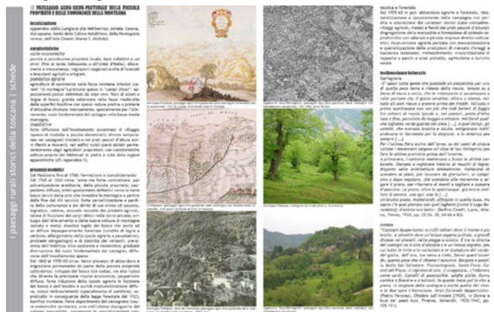
Figura 3. Scheda tipo estratta dall'elaborato "I paesaggi rurali storici".

All'interno di questa tripartizione lo studio individua venti paesaggi rurali storici, per ognuno dei quali vengono illustrate: la localizzazione; le caratteristiche socio-economiche e paesistico-agrarie e insediative; i principali processi evolutivi dall'origine a oggi; alcune testimonianze letterarie. Ogni scheda è corredata da un apparato iconografico composto da fotografie terrestri e da estratti di ortofotocarte contemporanee e storiche (come il Volo Gai del 1954), oltre che da raffigurazioni di varia natura (dipinti, disegni, cartografia storica ecc.).