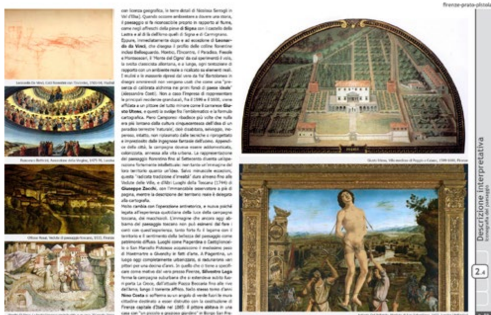
Figura 2. Un estratto dell'elaborato "Iconografia del paesaggio" della scheda d'ambito 06 - Firenze Prato Pistoia.