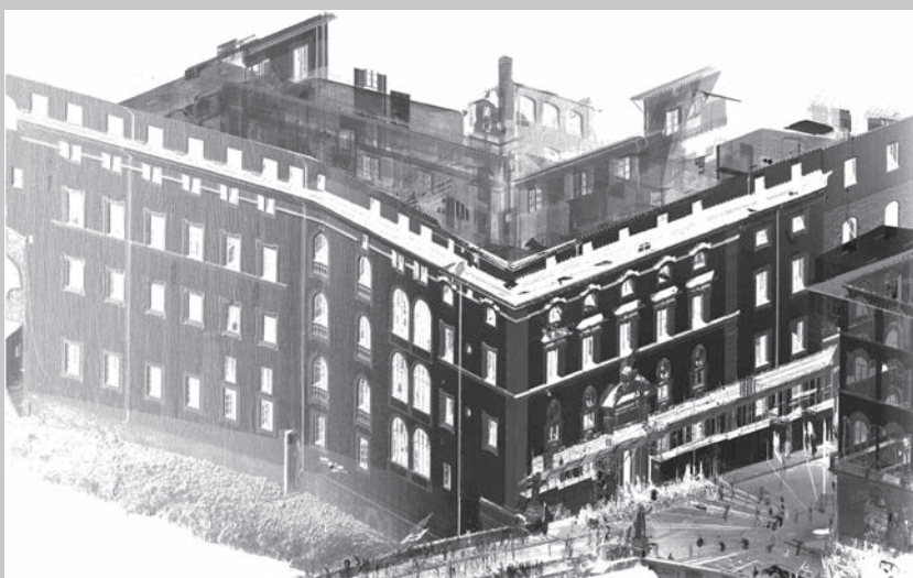
Fig. 4 - Documentazione morfometrica e cromatica del Palazzo della Missione per la ricostruzione delle vicende storico-architettoniche della fabbrica, Firenze (Alessandro Merlo, Gaia Lavoratti, Giulia Lazzari, Andrea Aliperta, Marco Corridori, Elisa Luzzi, Francesco Frullini).

Morphometric and chromatic documentation of the Palazzo della Missione for the reconstruction of historical-architectural developments, Florence (Alessandro Merlo, Gaia Lavoratti, Giulia Lazzari, Andrea Aliperta, Marco Corridori, Elisa Luzzi, Francesco Frullini).