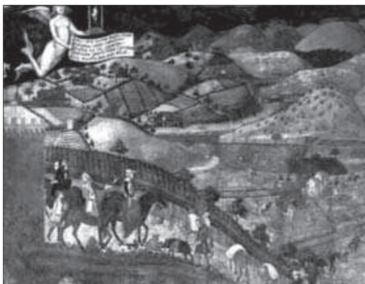
Figura 1. Nell'affresco che rappresenta gli effetti del Buon Governo un quadro delle attività rurali illustra anche un contadino che riporta dal pascolo un suino di razza Cinta senese (da A. Lorenzetti)

Anche il Pianigiani (1907), autore di uno dei più famosi vocabolari etimologici italiani, fra le altre radici ricorda, concordando col predetto Autore, il possibile collegamento fra il termine “pascolo” e il termine “bosco”.