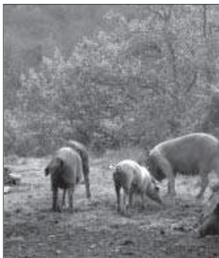
Figura 2. Suini al pascolo nei boschi della Montagnola senese

all'inizio ha riguardato principalmente i riproduttori, oggi è esteso anche alla fase d'ingrasso, con particolare riferimento al finissaggio, per la produzione di suini di qualità superiore. Gli eventuali maggiori costi per l'ingrasso dei suini all'aperto possono essere compensati da una maggiore remunerazione alla vendita, attuabile nell'ambito di produzioni di qualità quali marchi individuali o collettivi, sistemi qualità (DOP, IGP, Label rouge ), produzioni biologiche, ecc.