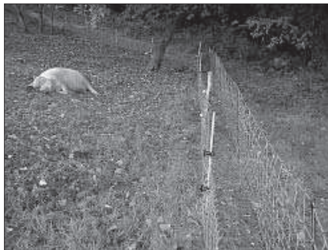
Figura 4. Doppia recinzione elettrificata per la gestione del pascolo suino (M.Barbari)

La limitazione dei danni da pascolamento dei suini può essere oggi facilmente conseguita sia applicando anelli nasali antigrufo (che sono in grado di impedire i ben noti fenomeni di scalzamento del terreno tipici dei suini) sia frazionando le zone di pascolo. In tali aree la realizzazione di adeguate recinzioni può consentire o precludere l'attività di pascolamento laddove si siano esaurite le risorse alimentari costituite dai frutti caduti dagli alberi. La realizzazione di opportune recinzioni rappresenta quindi l'esigenza di base per organizzare l'allevamento dei suini all'aperto. La soluzione tecnica più semplice è rappresentata dalle recinzioni elettrificate, di tipo analogo a quelle utilizzate per il pascolo di altri animali domestici (bovini, ovini, equini) (Fig. 4.).