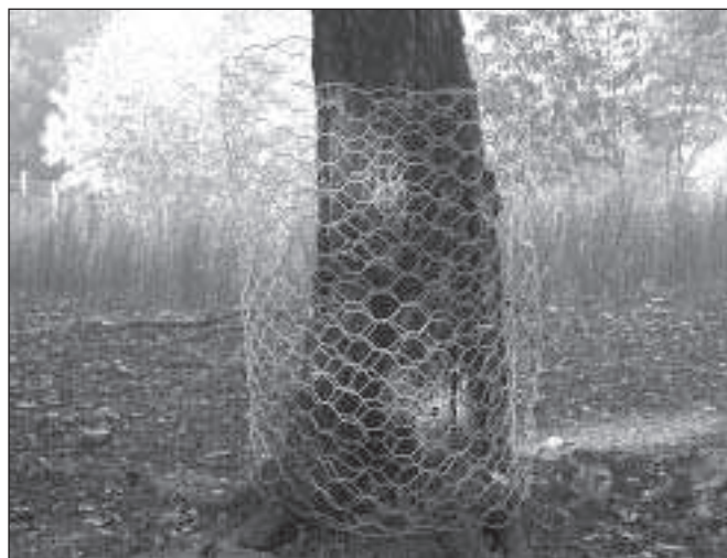
Figura 5. Semplice sistema di protezione del fusto di una quercia all'interno di un recinto di concentrazione di suini. (F. Sorbetti Guerri)

La limitazione dei danni da pascolamento dei suini può essere oggi facilmente conseguita sia applicando anelli nasali antigrufo (che sono in grado di impedire i ben noti fenomeni di scalzamento del terreno tipici dei suini) sia frazionando le zone di pascolo. In tali aree la realizzazione di adeguate recinzioni può consentire o precludere l'attività di pascolamento laddove si siano esaurite le risorse alimentari costituite dai frutti caduti dagli alberi. La realizzazione di opportune recinzioni rappresenta quindi l'esigenza di base per organizzare l'allevamento dei suini all'aperto. La soluzione tecnica più semplice è rappresentata dalle recinzioni elettrificate, di tipo analogo a quelle utilizzate per il pascolo di altri animali domestici (bovini, ovini, equini) (Fig. 4.).