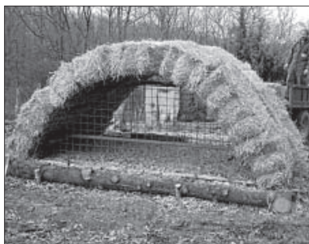
Figura 7. Capannina in paglia in fase di realizzazione (F. Sorbetti Guerri)

Nel caso della capannina in paglia risulta semplicissima la rimozione e lo smaltimento delle vecchie presse (quando si sono deteriorate) e la loro sostituzione con altre nuove.