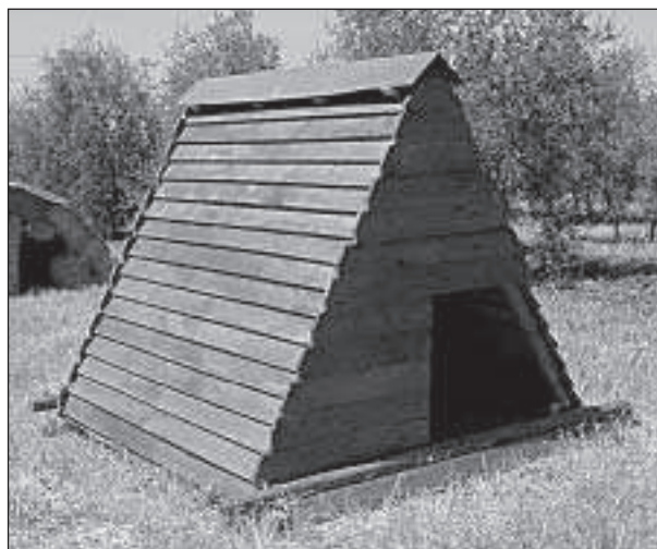
Figura 6. Capannina-parto in legno progettata dagli autori pronta per l'effettuazione di prove comparative (L.Conti)

Per ottenere un miglioramento in termini di prestazioni produttive dei suini allevati allo stato semibrado si deve, innanzitutto puntare a ottimizzare la gestione della fase parto e allattamento. A tale scopo occorre raggiungere l'obiettivo di ridurre le perdite di suinetti dopo il parto, minimizzando il numero delle perdite per schiacciamento e riducendo i rischi di attacchi da parte di predatori, quali volpi, lupi, cani, ecc.