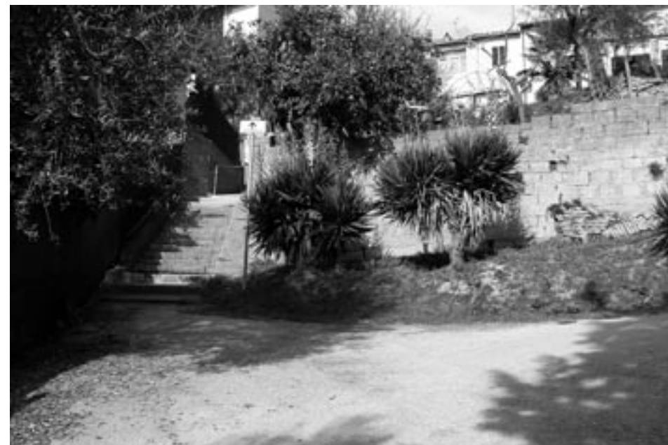
Fig. 11: San Miniato, le stesse scale per accedere alla campagna, nella attuale condizione di degrado del patrimonio architettonico.