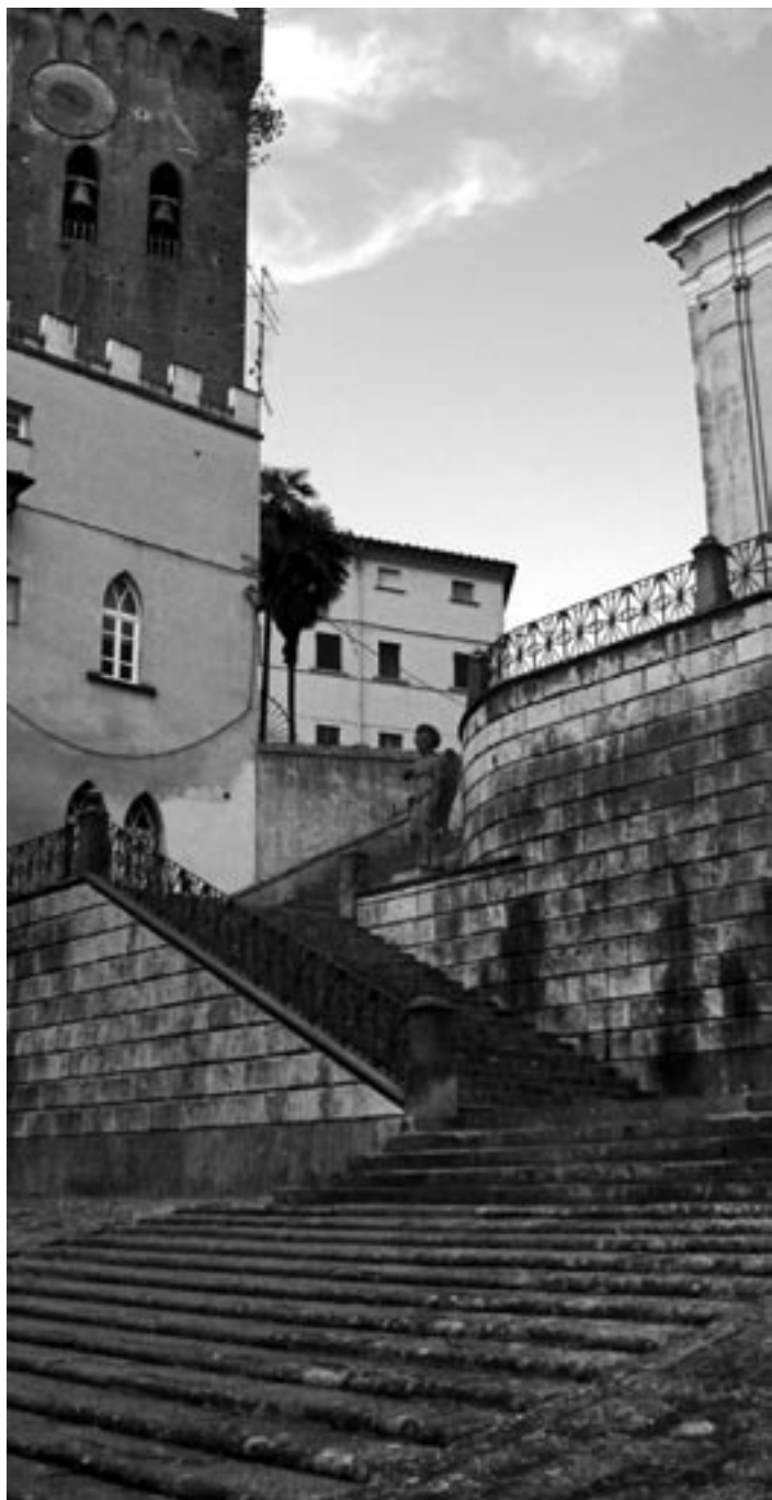
Fig. 4 – Scale nella scena urbana in San Miniato.