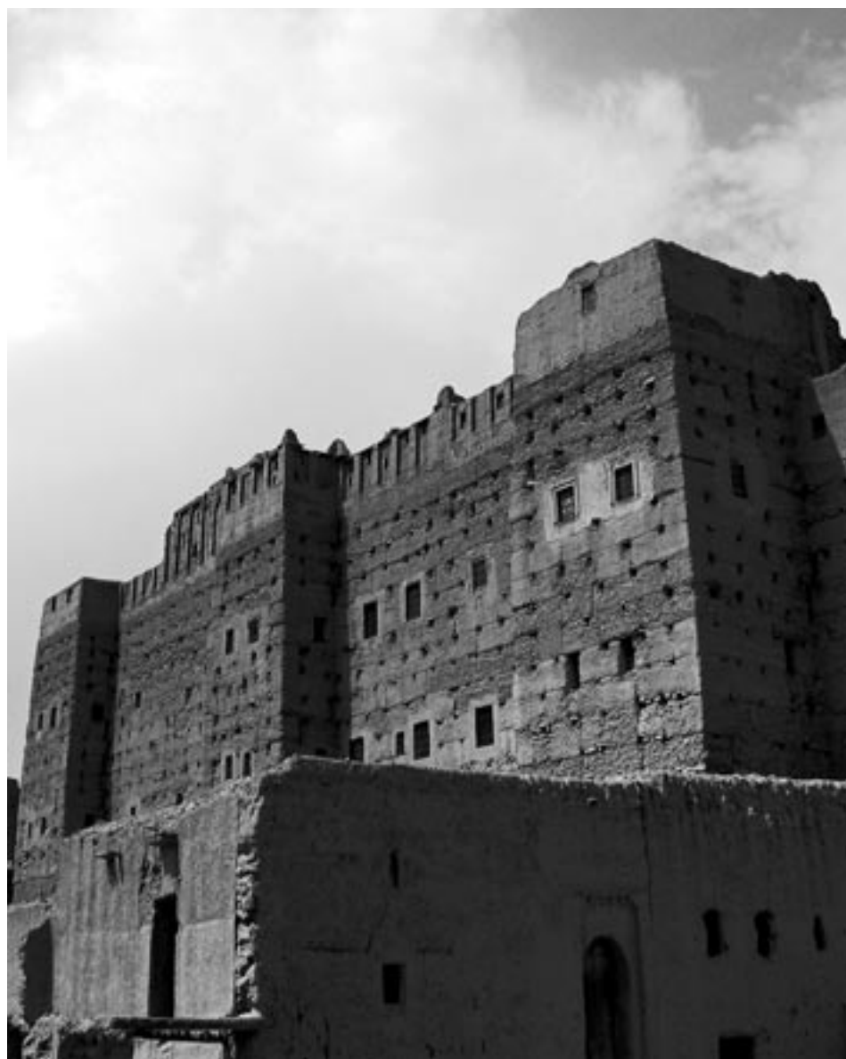
Fig. 6 – Lo ksar di Tamnougalt, Valle del Draa, Marocco.