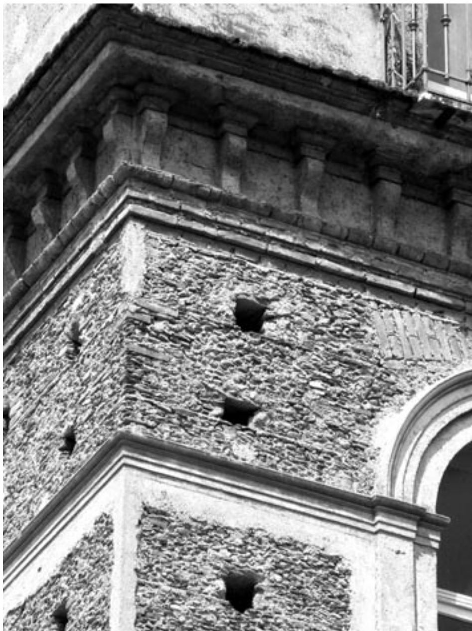
Fig. 2 – Edificio in Lamezia Terme, Italia, muratura “civata”.