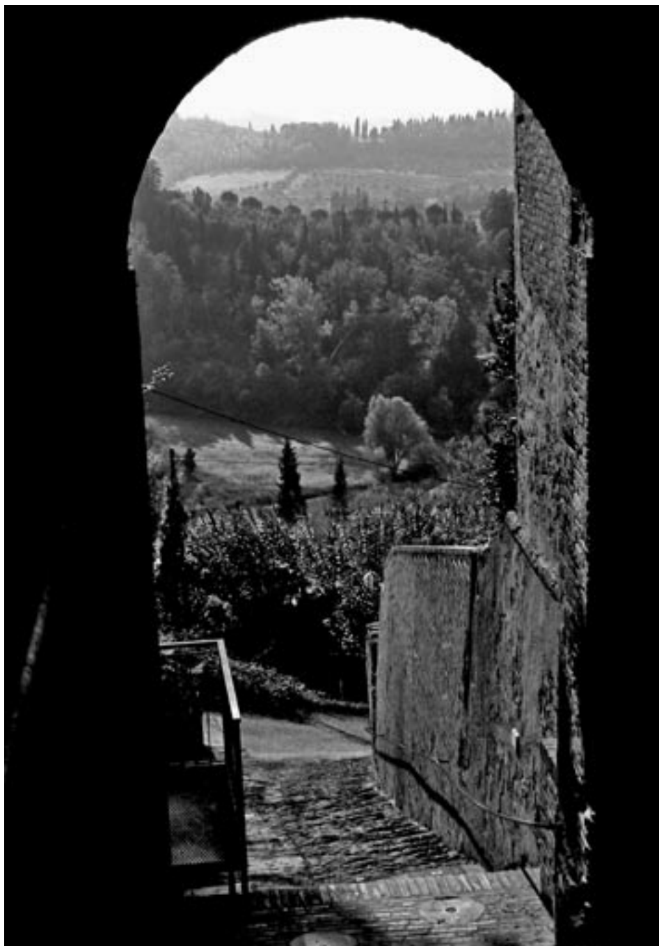
Fig. 8 – Paesaggio intorno San Miniato.