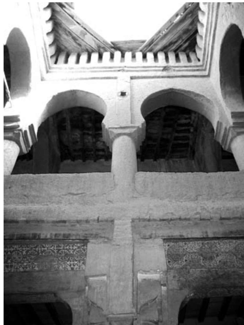
Fig. 7 – Patio in Tamnougalt, Valle del Draa, Marocco.