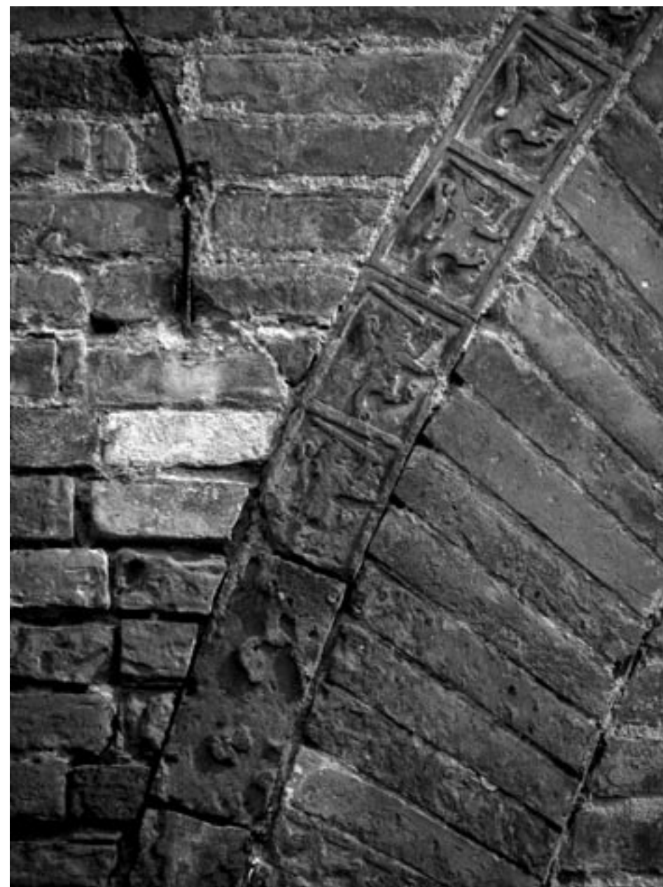
Fig. 1 – Dettaglio del palazzo vescovile, San Miniato

Oggi la valorizzazione dei saperi locali per lo sviluppo, anche per una Istituzione come l'Accademia degli Euteleti, significa un lavoro continuo, sistematico e profondo di ricerca, riscoperta, esplicitazione, codificazione e valorizzazione delle conoscenze locali e tacite, per contribuire alle azioni per la formazione e l'apprendimento, per la diffusione della conoscenza, per la progettazione delle innovazioni, per lo sviluppo delle capacità di governo e della partecipazione.