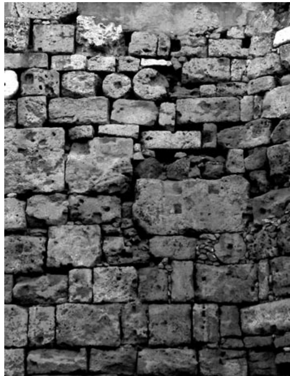
Fig. 3 – Mura di Chania, Creta, Grecia.