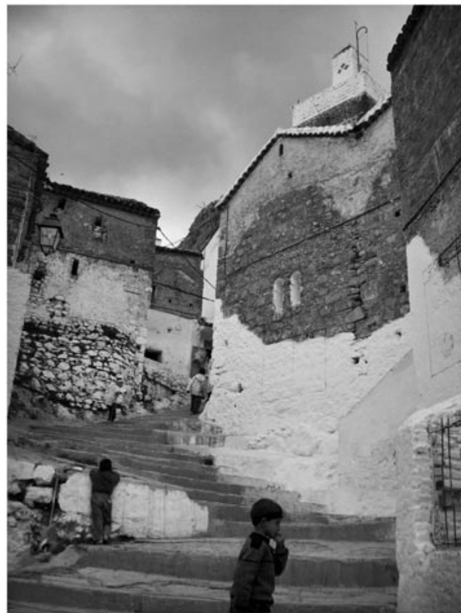
Fig. 5 – Scale nella scena urbana in Chefchaouen, Marocco.