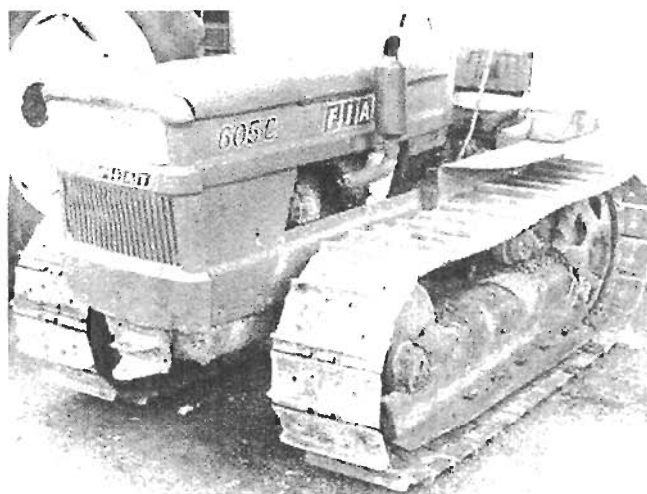
Fig. 6 – Il cingolato ancora attuale FIAT 605 C

petrolio, di cilindrata pari a 2.270 cc; successivamente queste furono sostituite da macchine più potenti e ingombranti come le FIAT 411 e 605.