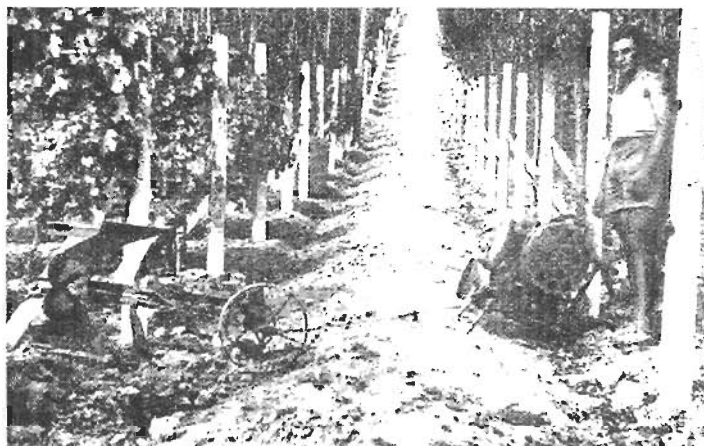
Fig. 3 – Aratura funicolare

meccanico erano dati dalle pendenze che non dovevano superare il 18-20%. I metodi d'altronde venivano frequentemente usati in combinazione. Una notevole innovazione fu raggiunta con l'impiego di macchine dirompitrice come i grandi scarificatori e con gli scavatori (lame apripista buldozer e angledozer); negli scassi ancora fatti in fossa vennero impiegati anche grossi assolcatori simili agli spazzaneve che avevano lo scarico laterale dei detriti 15 .