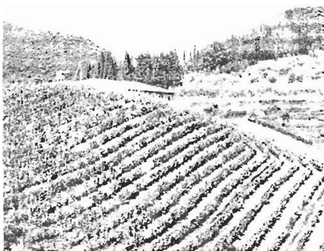
Fig. 2 – Uno dei più significativi impianti specializzati degli anni '50. Azienda Brollo , sistemazione a spina del Breviglieri

viticoltura. Infatti il motore impiegato nei lavori viticoli, sia esso montato su una trattrice, o comandi direttamente gli utensili lavoranti, deve soddisfare a esigenze particolarissime, oltre a quelle generali cui deve rispondere in tutte le altre applicazioni; tali, fra l'altro: ingombro ridotto a un minimo, stabilità e facilità di guida eccezionali anche su terreni in pendio perché la macchina deve lavorare tra filari vicini e quindi con carreggiata rigidamente vincolata, virata contenuta entro un raggio estremamente ridotto. A queste difficoltà di ordine tecnico aggiungasi quelle di natura economica, opponendosi alla diffusione della macchina specializzata quale il maggior costo del lavoro derivante dal minor grado di utilizzazione che ha la macchina specializzata. In questo stato di cose era logico che la macchina per i vigneti fosse trascurata dai costruttori. 6