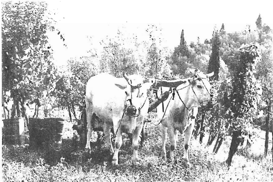
Fig. 1 – La pariglia di buoi, il motore della mezzadria

consente inoltre un impiego adeguato delle macchine con una conseguente scarsa utilizzazione annua... sarebbe quindi auspicabile che l'istituzione della fattoria assumesse in se la dotazione di macchine da fare impiegare in forma associata nelle proprie unità poderali. 1