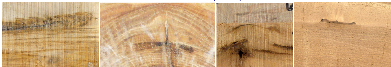
inclusione di corteccia