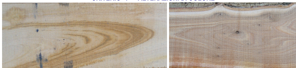
alterazione di colore (legno scuro)