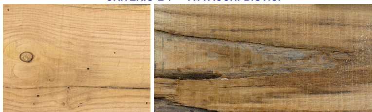
attacco di insetti