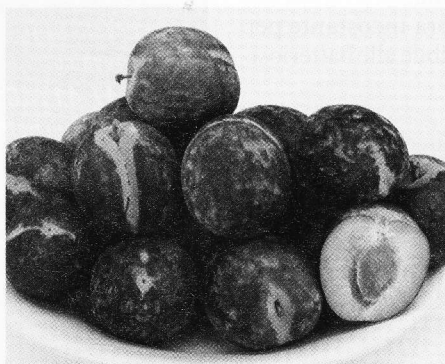
Tra le cv europee Firenze '90® è quella con la maggiore precocità di maturazione, rusticità e produttività.

● Precocità di maturazione, rusticità e produttività dell'albero, buona pezzatura. ● Scartata al Nord. Qualità mediocre.