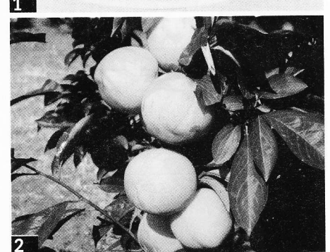
1. Carmen Blu®, cv cino-giapponese precoce, ha buona produttività ma incostante. Foto: Dofì-Firenze. 2. Anne Gold®, cv cino-giapponese che matura in epoca Shiro, ha buona produttività e pezzatura. Foto: Dofì-Firenze

tati non sembrano soddisfare le richieste del nostro mercato a causa della scarsa pezzatura dei frutti.