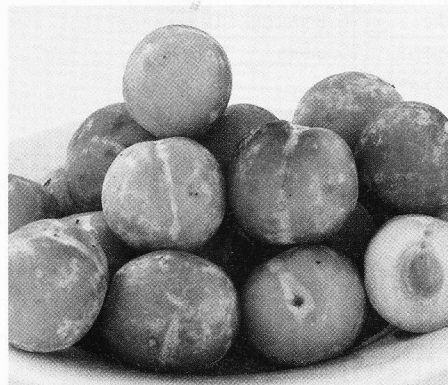
T.C. Sun® è ritenuta tra le migliori per le caratteristiche organolettiche.

Per il periodo intermedio si segnalano Anne Gold* (+7 gg), a buccia gialla, con buona produttività dell'albero e grossa pezzatura, interessante per aspetto, consistenza e sapore. Seguono le 3 cultivar a buccia nera Blackamber® (+10 gg), Black Gold® (+13 gg) e Black Diamond® (+23 gg) giudicate positivamente per i caratteri po-