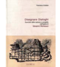
Francesca Privitera Disegnare Dialoghi Esercizio della sezione e progetto nell'opera di Giovanni Michelucci Bandedotti e Vivadi Editori, Pontedera 2008