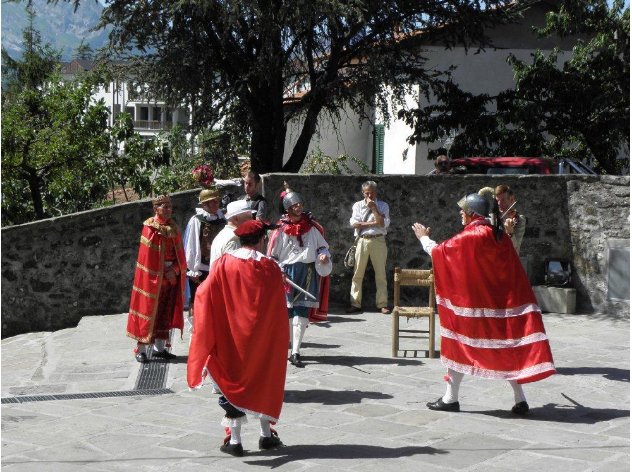
Magnano-Giuncugnano (LU), 2.08.2009 Compagnia dei maggianti di Montignoso (MS) Maggio La Pia de' Tolomei

Nel dispositivo che ordina e dota di senso la performance narrativa dei testimoni, il termine più frequentemente usato per significare il loro allarme è “passione” intesa come meccanismo primo dell'agire, quella che permette di resistere e difendere pervicacemente il loro canto, l'espressione più viva di quel teatro che incarna un sistema di valori, ancora oggi, ampiamente condiviso. Non si tratta di un sentimento intimo, quando si domanda che cosa essa sia esattamente la risposta transita dal piano definitorio a quello giustificativo e si scopre che la si è ereditata (quasi tutti provengono da famiglie in cui uno o più componenti hanno avuto a vario titolo a che fare con il Maggio), all'interno di un sistema dove sono stati “incorporati” i modi del sentire e dell'agire.