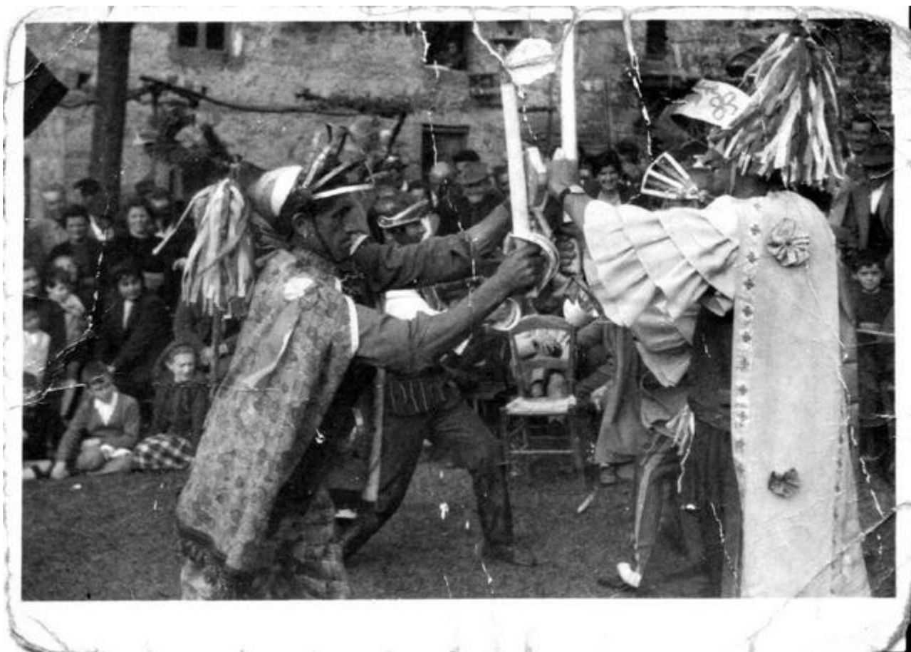
Pieve San Lorenzo-Minucciano (LU), 1960 (c.a.) Compagnia dei maggianti di Pieve San Lorenzo Maggio Frontino (collezione privata)

Sebbene asimmetrici, i rapporti di mutuo scambio tra oralità e scrittura costituiscono, nel caso del Maggio in primo luogo, ma anche degli altri generi teatrali presenti nella regione, un terreno continuamente frequentato in ambo le direzioni: dalla tradizione letteraria alla memorizzazione, al testo drammatizzato sebbene non necessariamente in questo ordine. Si può giungere alla stesura del copione passando dalla memoria orale, in genere per porzioni di testo più o meno ampie, o direttamente dalla rielaborazione di un originale e quindi da scritto a scritto. L'altro percorso bidirezionale si verifica nel transitare dalla stampa al manoscritto, le redazioni a stampa dei maggi ottocenteschi o del primo novecento uscite dalle tipografie Sborgi, Baroni, Carrara, Salani 5 , vengono rielaborate e affidate alla scrittura per poi tornare, soprattutto dagli anni ottanta in avanti, quando si afferma una capillare attività editoriale per questo genere di testi, alla stampa.