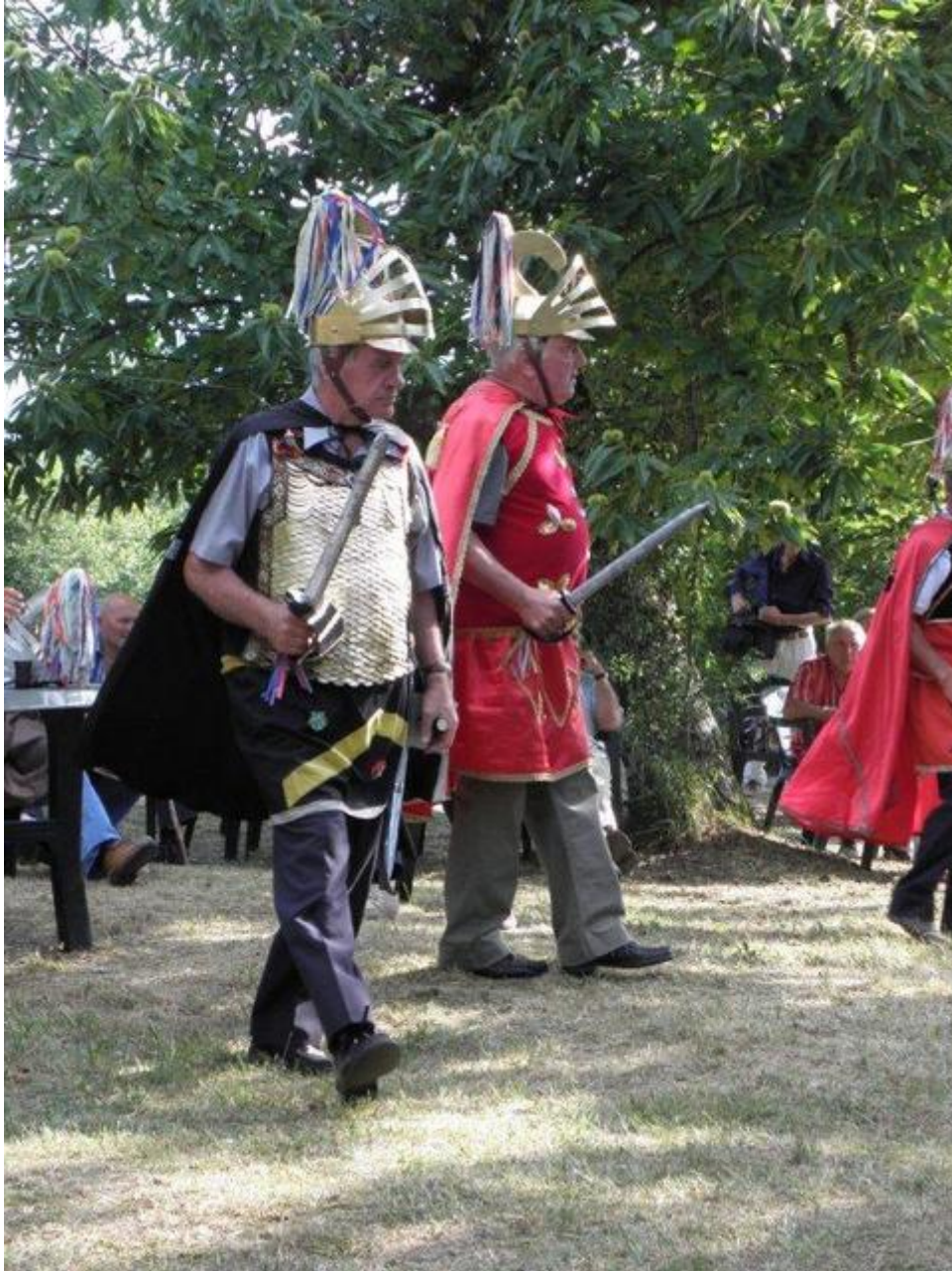
Varliano-Giuncugnano (LU), 2.08.2009 Compagnia dei maggianti di Filicaia-Gragnanella-Casàtico (LU) Maggio Romolo e Remo