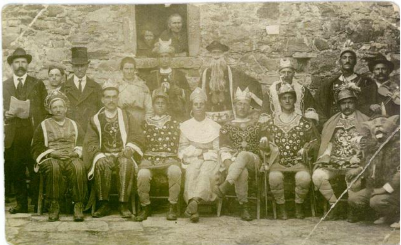
Cogna-Piazza al Serchio (LU), 1922 (o 1923) Compagnia dei maggianti di Cogna Maggio Fioravante

Il canto lirico eseguito fra il 30 Aprile e il primo maggio, infatti, appartiene ad altra fenomenologia e può anche darsi che su quell'azione rituale si sia innestato il dramma e che dunque esista un rapporto di filiazione, come ritiene Paolo Toschi ma, allo stato attuale degli studi, non siamo in grado di poterlo sostenere con certezza neanche approssimativa a causa degli anelli che ancora mancano al definitivo saldarsi di tale ipotesi.