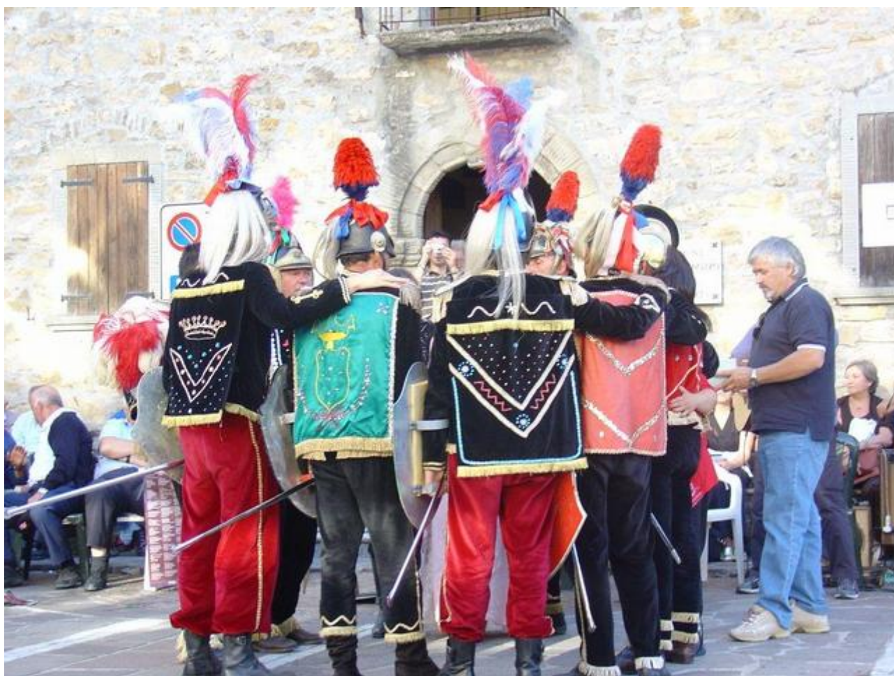
Villa Minozzo (RE), 24.08.2008 Compagnia del Maggio Valdolo (RE) Maggio I fratelli ammutinati

consoni alla vicenda rappresentata; oppure il suggeritore/regista sempre più frequentemente interrompe il canto, si rivolge al pubblico anticipando e riassumendo larghe sezioni della trama del testo per esplicitare quei passaggi che di norma venivano lasciati all'intuizione degli spettatori. Altre variazioni si registrano per tutti quegli accorgimenti adottati, relativi a scenografia e recitazione, nel tentativo di introdurre elementi di veridicità in uno spettacolo che ne era esente.