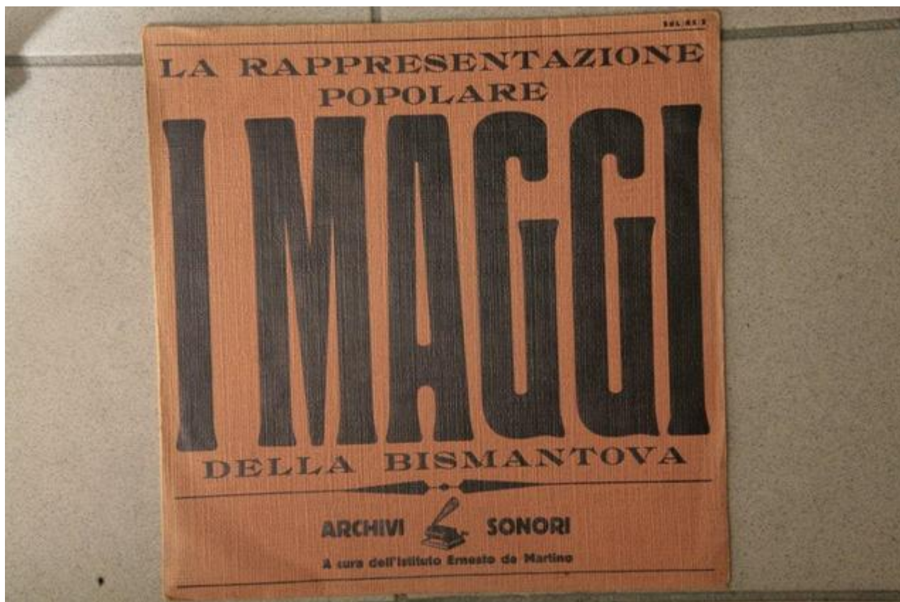
I Maggi della Bismantova, SdL/AS/2 Archivi sonori. A cura dell'Istituto Ernesto De Martino Registrazioni di Gianni Bosio

E proprio con l'intento di essere sempre più aderenti a un certo tipo di spettacolo, di orientare, non