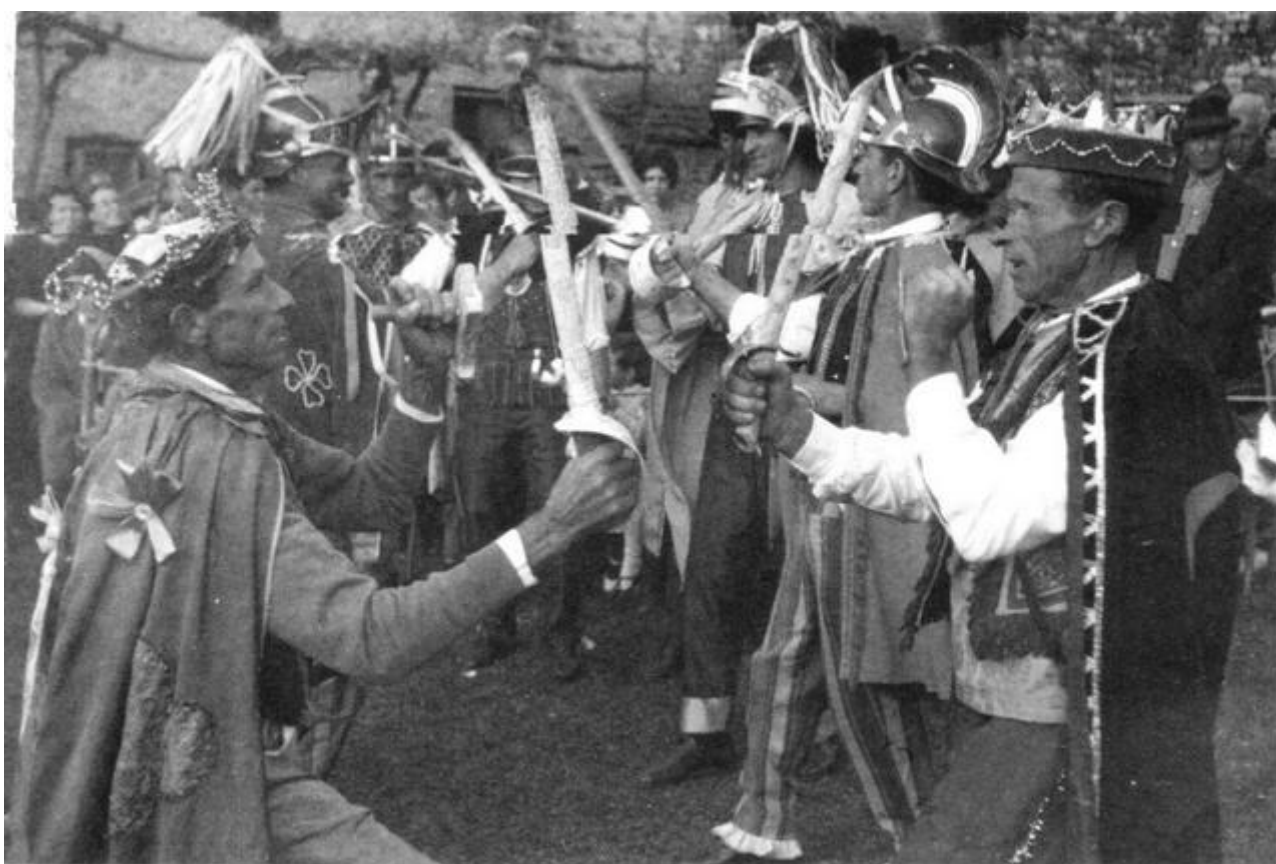
Pieve San Lorenzo-Minucciano (LU), 1960 (c.a.) Compagnia dei maggianti di Pieve San Lorenzo Maggio Frontino

sotto il profilo spettacolare, a cominciare dai costumi per giungere all'uso del gesto codificato. Non ho personalmente notizia della presenza del testo palermitano fra gli autori toscani, ma la tipologia entro cui si colloca è del tutto simile a quella di tanti altri testi che son serviti per scrivere Maggi; nelle biblioteche domestiche degli autori talvolta si rinvengono versioni ridotte o variamente riadattate, in versi o in prosa. di opere inizialmente destinate ad altro pubblico, come la versione romanzata de I due sergenti di J.M.T.B. D' Aubigny e la versione polimetra per cantastorie, I due sergenti o la vera amicizia. Fatto avvenuto al porto Vandr  (Francia) (Firenze, Salani 1906), o le tante edizioni in poesia (Ottave) e in prosa della Pia de' Tolomei che dipendono dal poemetto di Benedetto Sestini, edito nel 1844, o ancora La strage degli innocenti , dall'omonima opera di Giovan Battista Marino, attraverso una stampa Sborgi del 1882. Pi  spesso, nella poco numerosa dote di libri, si trovano le edizioni integrali della Commedia , del Furioso , della Gerusalemme Liberata ; a tale scelta partecipano ragioni di predilezione che, nel cuore della Toscana, non sono soltanto personali, ma in qualche modo sono state collettivizzate e se ne viene a conoscenza dalle testimonianze degli autori quando raccontano del loro apprendistato fatto invariabilmente di veglie e di letture ad alta voce, di declamazione dei passi memorizzati.