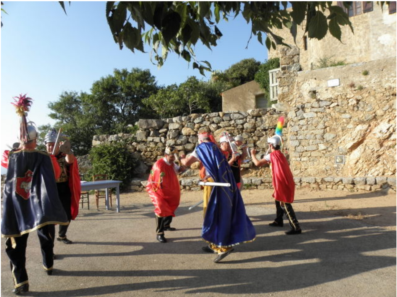
Pigna (Corsica), 10.07.2011 Compagnia dei maggianti di Gorfigliano (LU) Maggio La Gerusalemme liberata

L'inizio della seconda fase del lavoro etnografico è partito con toni dimessi da parte mia, senza preoccupazione dell'ordine delle cose e senza schemi prestabiliti.