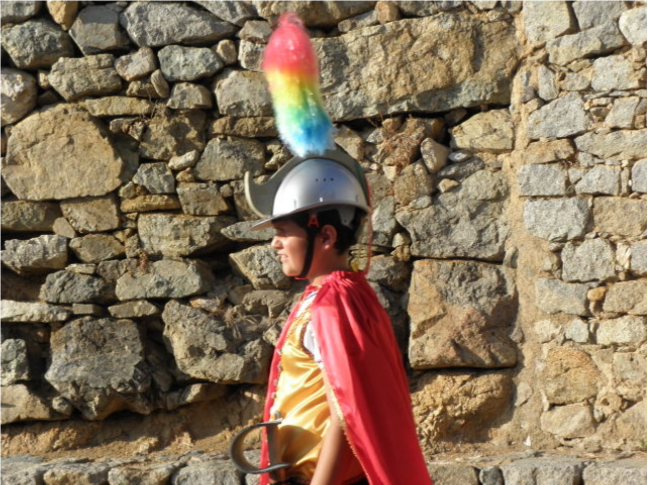
Pigna (Corsica), 10.07.2011 Compagnia dei maggianti di Gorfigliano (LU) Maggio La Gerusalemme liberata

conoscenza empirica non precludeva un'eventuale sistematizzazione interpretativa, ma in accordo con un modello classico, la teorizzazione avrebbe riguardato un secondo momento. Non bandivamo la soggettività interpretativa, di per sé sempre confutabile, ma il raggiungimento di conclusioni affrettate non sufficientemente suffragate da prove “osservabili”; in piccolo la ricerca della “falsificazione” e un doppio esercizio di controllo sul proprio operato a favore di se stessi e della restituzione. Lo scardinamento di presunte certezze ha presupposto l'obbligo di riconsiderare la propria e l'altrui collocazione, anche attraverso la verifica in ordine all'applicabilità delle teorie che si rivolgono alla comprensione culturale, a come pensare per comunicare al fine di non riprodurre un'immagine statica.