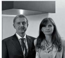
EMILIO FAROLDI ASSOCIATI