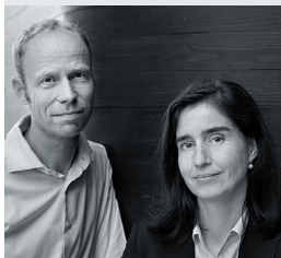
LUDLOFF + LUDLOFF ARCHITEKTEN