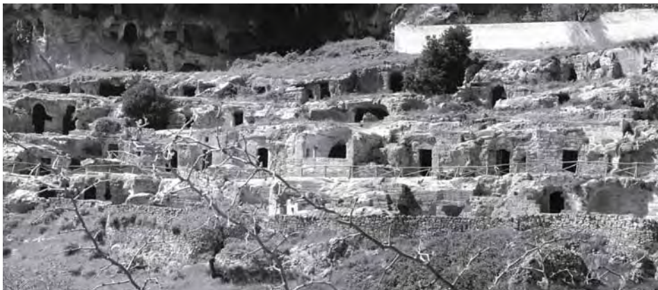
Fig.1 Village of Rivolta, Ginosa

The Partners activity have been shown in a touring exhibition and in its relative catalogue; the works during the institutional workshops are collected in a video and published in some section on www.rupestrianmed.eu ; the meetings proceedings and the partners researching activity have been published by the promoter partners, in particular by the Archeogruppo “E. Jacovelli” and Dadsp - UniFi.