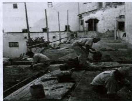
Figura 3. Firenze, SBAPSAE, Archivio corrente, Pos. A/187, cart.1, veduta dell'estradosso delle volte del chiostro

della disciplina del restauro, in particolare a Firenze dove, grazie alla sua attività ha trasformato la prassi del restauro da tecnico artistica a tecnico scientifica, incrementando l'attenzione e lo studio del testo architettonico e delle sue caratteristiche fisico matematiche oltre che artistiche, in quanto riteneva che il manufatto stesso fosse il miglior documento di conoscenza.