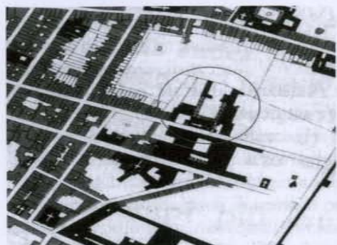
Figura 2. Pianta di Firenze elaborata sulla base dei rilievi catastali del 1832 (Fanelli, G. 1980 p. 186); il chiostro è delimitato da tre bracci: est, sud, ovest.