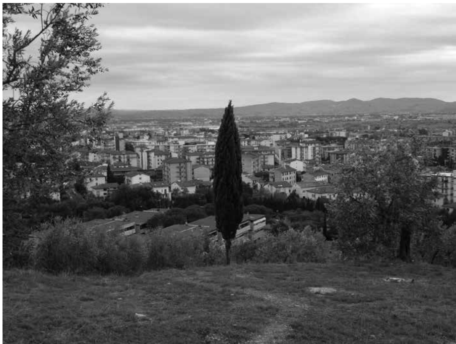
Fig. 1 Scorcio della Piana di Firenze dalle colline di Querceto (Sesto Fiorentino), ottobre 2011

ecobiologici, dei quali viene ridotta la capacità di resilienza, e idrogeologici, con gravi conseguenze di dissesto (frane, fenomeni erosivi, subsidenza, impermeabilizzazione, desertificazione) e di contaminazione sia diffusa che puntuale.