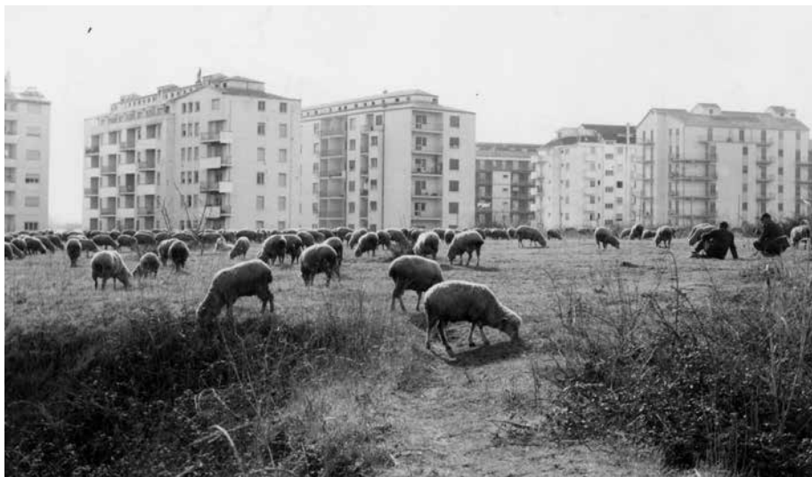
Fig. 2 Palazzi e pecore, anni sessanta

Nell'ambito della Legge 724 del 1994 Misure di razionalizzazione della spesa pubblica venne approvata una nuova sanatoria semplicemente prorogando al 31 dicembre 1993 la possibilità di presentare richiesta di condono e lo stesso accadde con il Decreto legge 269 del 30 settembre 2003 Disposizioni urgenti per favorire lo sviluppo e per la correzione dei conti pubblici che fissa, con il dichiarato scopo di "far cassa", la possibilità di sanare l'abuso fino al 31 marzo 2003, mentre gli stanziamenti approvati per la riqualificazione urbanistica, ambientale e paesaggistica sono ampiamente insufficienti.