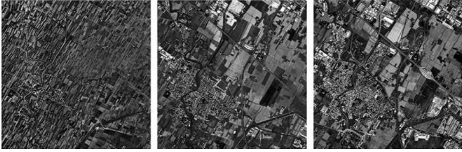
Fig. 4 Campi Bisenzio 1954-1988. La sequenza di fotografie aeree documenta il radicale cambiamento avvenuto tra il 1954 e il 1978 nella Piana di Firenze. Il mosaico di campi coltivati evolve in un disegno a larghe maglie, mentre Campi Bisenzio si trasforma in una città che ingloba le frazioni di S.Martino, S.Giusto e Capalle. Si riconoscono alcune permanenze come l'autostrada Firenze-mare (1923) che taglia la geometria del terreno, il corso sinuoso del Bisenzio e quello più lineare dei torrenti Marina e Garille. Gli argini del collettore acque basse, il Fosso Reale, intersecano l'Autosole, grande opera datata 1963. Dopo il 1978 si registra una crescita edilizia meno imponente e interventi più strutturali, come il complesso nodo di svincolo A1-A11, la discarica di Case Passerini, le rotonde della nuova circonvallazione, il parco di Villa Montalvo

L'area critica per eccellenza è tuttavia l'area metropolitana centrale, polarizzata attorno alle tre città di Firenze, Prato e Pistoia, dove maggiore è la concentrazione di attività produttive e di scambio di beni e di servizi e massima è la densità residenziale e di infrastrutture.