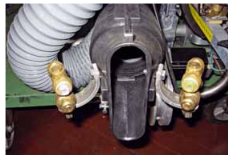
Modulo di irrorazione con coppia di ugelli eroganti il 70 e il 30% della portata necessaria per ogni banda, azionati l'uno, l'altro o entrambi per variare il trattamento sulla parete

L'innovazione consiste nell'impiego della meccatronica, della geo-referenziazione, delle mappe di prescrizione e della telemetria, per l'attuazione delle scelte più appropriate e il tracciamento delle operazioni sul campo.