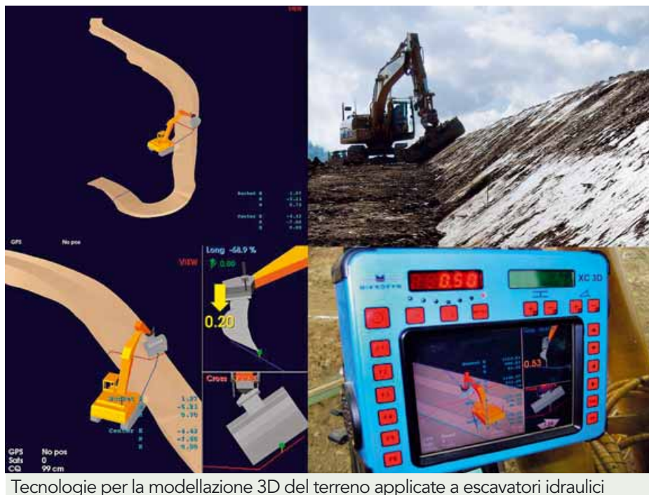
Tecnologie per la modellazione 3D del terreno applicate a escavatori idraulici

Lo sviluppo di strumenti operativi è ora rivolto alla capitalizzazione dell'informazione su quelle conoscenze e competenze che da sempre caratterizzano la cultura della società rurale. Attualmente stiamo riscoprendo ciò che è stato ab-