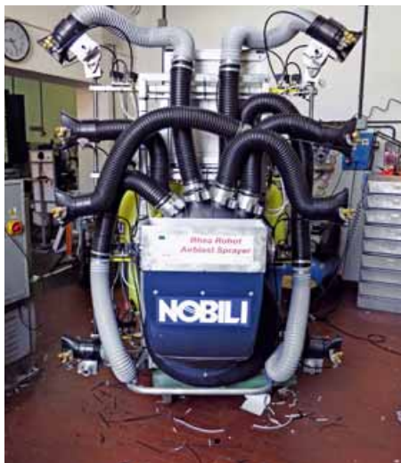
Macchina irroratrice a rateo variabile (VRT) realizzata nell'ambito del Progetto Rhea

grazie a sistemi di rilevamento remoti e prossimali (Johnson et al. , 2003; Bramley et al. , 2004; Reynolds et al. , 2007; Acevedo Opazo et al. , 2008). Ulteriore evoluzione è rappresentata dall'utilizzo di sistemi di acquisizione dati 3D, di sensori a ultrasuoni e, ancor più, del Lidar che consente di ottenere informazioni sulla geometria della parete vegetale e fornisce migliori orientamenti per le pratiche colturali (Moorthy et al. , 2008; Llorens et al. , 2011). Alcune importanti operazioni meccanizzate sono oggi eseguite con attuatori di base controllati da sensori prossimali, mappe di prescrizione o interfacce di navigazione.