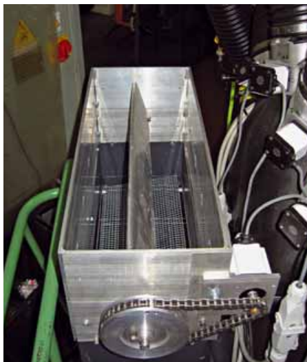
Valvola a farfalla principale per la gestione dell'aria in ingresso sul ventilatore

Il nuovo dispositivo progettato presenta le seguenti caratteristiche: