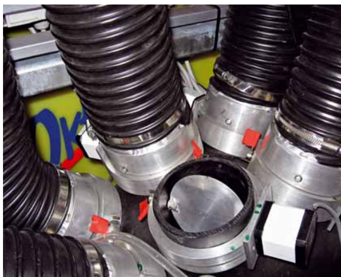
Complesso di valvole a farfalla per la gestione dell'aria dei singoli moduli

A tale scopo, l'ingegneria delle produzioni vitivinicole può contare oggi sulla geomatica, sulla sensoristica e su tutte le applicazioni informatiche specifiche. Allo stesso modo, le macchine agricole possono ora beneficiare di tecnologie a rateo variabile, di telemetria e della condivisione web (Reynolds et al. , 2007).