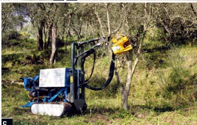
Foto 6 Motrice realizzata nel Progetto Candia (a) e scuotitore sviluppato dallo studio Ente Cassa di Risparmio di Firenze (b) e (c)

In alternativa alla testata scuotitrice, possono essere efficacemente applicati pettini vibranti, particolarmente indica-