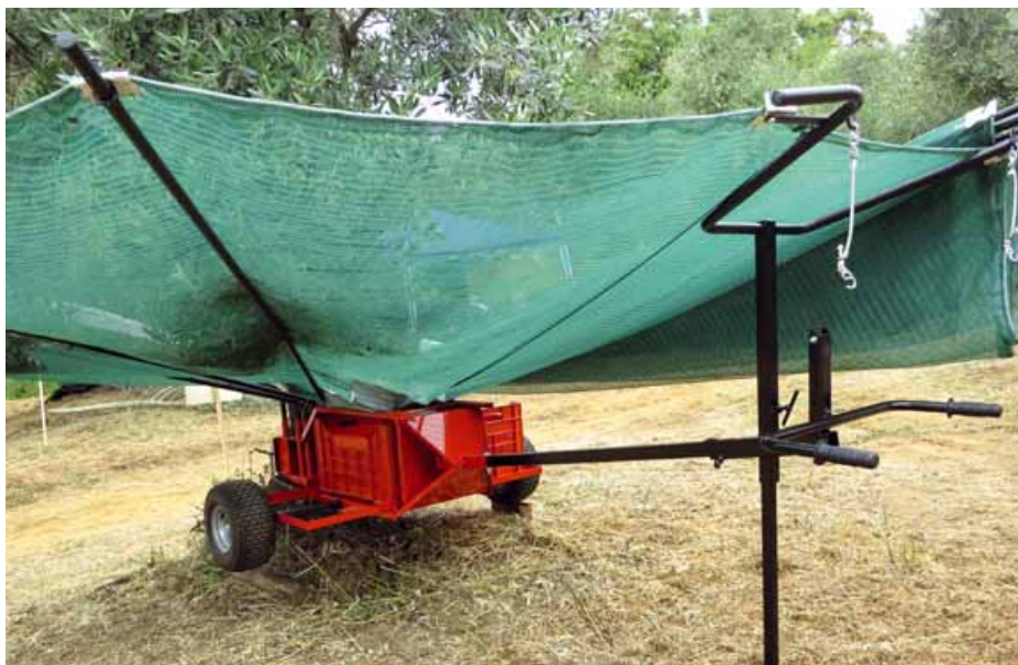
Foto 8 Ombrello manuale Bosco, una rivoluzionaria soluzione per il recupero delle olive

d'impresa che si dedicano al servizio nelle piccole-medie aziende, impossibilitate a effettuare investimenti economici. L'accoppiamento della testata scuotitrice a un piccolo escavatore ne rende possibile l'impiego in zone difficilmente agibili.