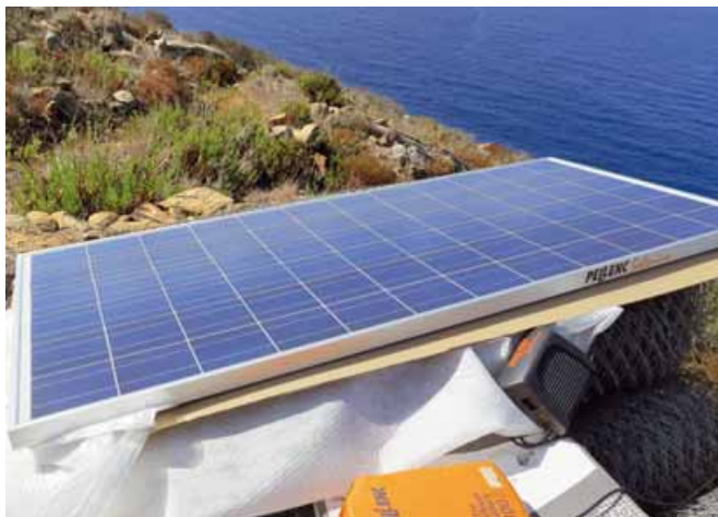
Foto 5 Pannello fotovoltaico per ricaricare le batterie al litio delle diverse attrezzature, presentato nella giornata dimostrativa all'Isola del Giglio. Il sistema permette di ricaricare le batterie a emissioni zero rispettando l'ambiente

Le motrici realizzate da Andreoli, nell'ambito del Progetto Candia negli anni 90, rappresentavano il primo prototipo di macchine semoventi per la viti-olivicoltura di montagna, a cui potevano essere accoppiati numerosi utensili per la gestione del suolo e della chioma (foto 6). Dalle esperienze maturate in quegli anni sono emersi nuovi sviluppi concretizzati, ultimamente, nella predisposizione di una testata scuotitrice. Il sistema realizzato con lo studio promosso dall'ente Cassa di risparmio di Firenze presenta uno scuotitore a polso snodato, derivante da un primo vecchio prototipo brevettato negli anni 60, la cui configurazione permette una regolazione di posizionamento della pinza da 0,3-1 m in altezza, rispetto al piano di campa-