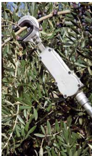
Foto 3 Agevolatori con innovativo gancio scuotitore