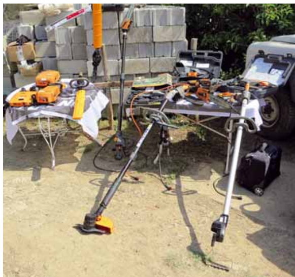
Foto 4 Agevolatori elettrici con controllo elettronico per la gestione del suolo e della chioma

gli attrezzi Pellenc sono alimentati da batteria zainata agli ioni di litio, che si contraddistingue per l'elevata autonomia offerta. Quelli di ultima generazione impiegano polimeri di litio che consentono una riduzione del peso e un aumento delle prestazioni. Recentemente è stato sviluppato un pannello fotovoltaico, presentato nelle giornate dimostrative, che permette di ricaricare le batterie autonomamente, allo scopo di creare un sistema a emissioni zero rispettoso dell'ambiente (foto 5).