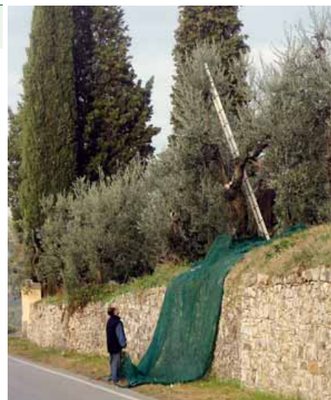
Foto 2 L'uso delle scale rappresenta il principale fattore di rischio nella olivicoltura