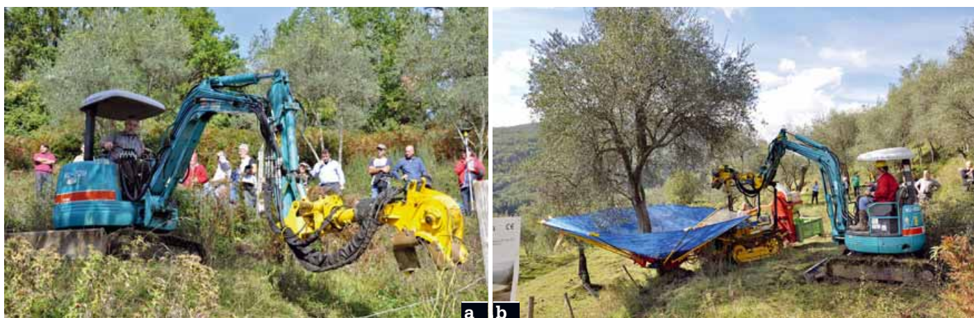
Foto 7 Scuotitore applicato a un escavatore (a) e cantiere con ombrello per il recupero delle olive (b)