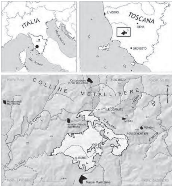
Fig. 1 Localizzazione dell'area di studio. Location of the study area.

Sotto l'aspetto litologico sono presenti formazioni assai diverse, sebbene la maggior parte dell'area di studio sia interessata dalle argilliti dei "Galestri e Palombini". Nella porzione centro-orientale ed in particolare alle quote più elevate affiora la serie toscana (SERVIZIO GEOLOGICO D'ITALIA, 1968, 1969) principalmente con le formazioni di "Calcarea cavernoso", "Calcarea massiccio" e "Calcarea ad avicula". A Podere Filetto e a Poggio Bruciato sono presenti anche piccoli affioramenti di arenaria "Macigno". Nella porzione occidentale, tra Poggiarello e Serra Paganico compaiono i conglomerati nei quali è presente anche materiale non comune come apfite porfirica e porfido granitico (sughereta di Serra Paganico). Lungo i Torrenti Milla, Ritorto, Pavone sono presenti modesti depositi alluvionali recenti; nella zona di Monte Arsentì si trovano depositi di travertino e al Podere i Piani depositi alluvionali terrazzati.