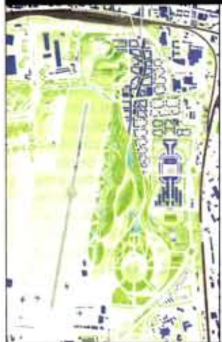
Castello. Scuola sottoufficiali dei carabinieri; masterplan dello Studio Fuktas per la «Cittadella dello sport»; Piano guida di Richard Rogers per l'intero comparto (anni novanta)

che cambia rispetto alle formulazioni precedenti è soprattutto la natura delle funzioni da insediare, in quanto nel frattempo una parte importante delle previsioni originali di natura direzionale e terziaria trova altre collocazioni.