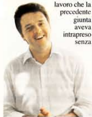
Il sindaco di Firenze Matteo Renzi

FIRENZE. Forse la vera notizia è che in città si fa ordinaria amministrazione. Un anno e mezzo dopo la sua vittoria all'elezione a sindaco nel giugno 2009, Matteo Renzi (36 anni) ha portato alla prima fase di approvazione da parte del Consiglio il Piano strutturale comunale (Psc), riprendendo il filo di un lavoro che la precedente giunta aveva intrapreso senza