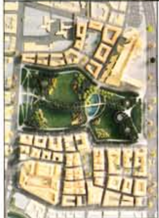
Novoli. Il comparto residenziale visto dal parco (Isolarchitetti); il Piano guida di Léon Krier

nini, così a ridosso della strada da non lasciare neppure lo spazio per un adeguato marciapiede, ma anche per la desolante povertà formale dello spazio pubblico. Le molte speranze di riscatto, affidate alla realizzazione del grande parco (progettato da Isolarchitetti), sembrano però affievolirsi man mano che i lavori vanno avanti. Del tutto inadeguate sono anche le realizzazioni edilizie, che hanno conferito all'insediamento un'immagine più rispondente ai criteri del postmoderno di matrice nordamericana che non ai dettami del genius loci . Di qualità architettonica incerta è anche il Palazzo di giustizia, realizzato a trent'anni di distanza dalla sua ideazione, per giunta a opera di altri