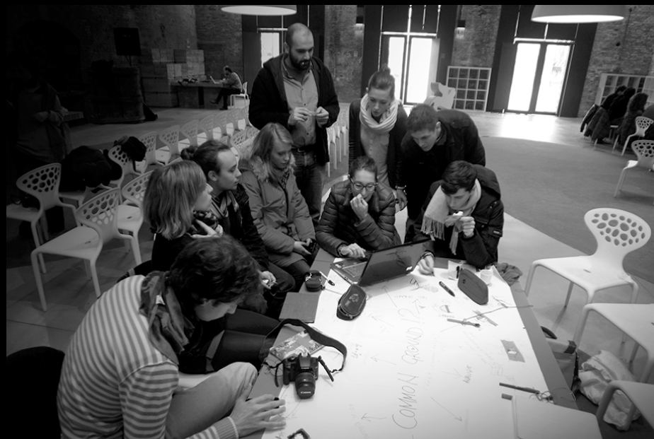
PADIGLIONE DELLE TESE DEI SOPPALCHI DURANTE LE ATTIVITÀ DI WORKSHOP