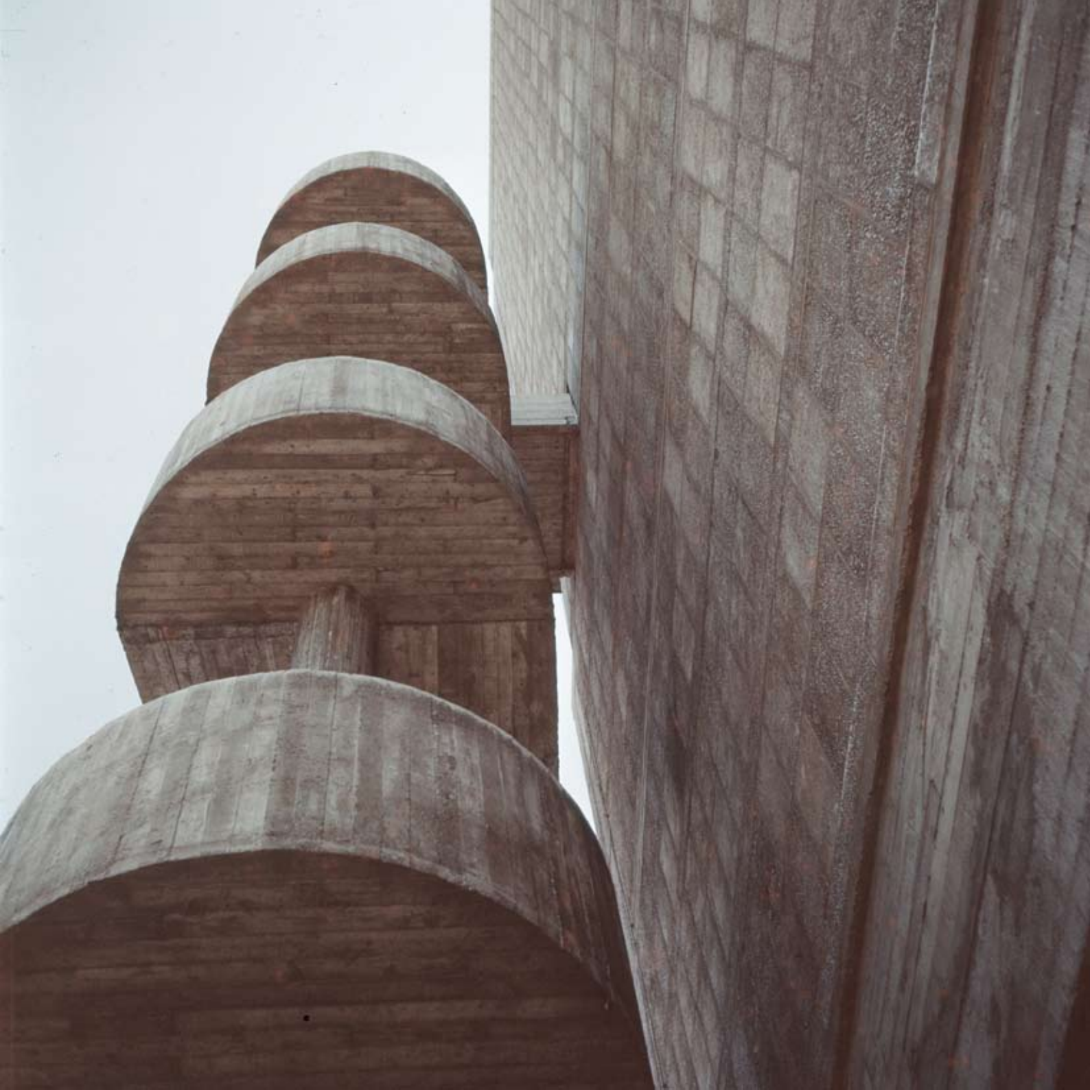
Unité di habitation di Marsiglia fotografata da Edoardo Detti (Archivio di Stato di Firenze, Fondo Edoardo Detti)