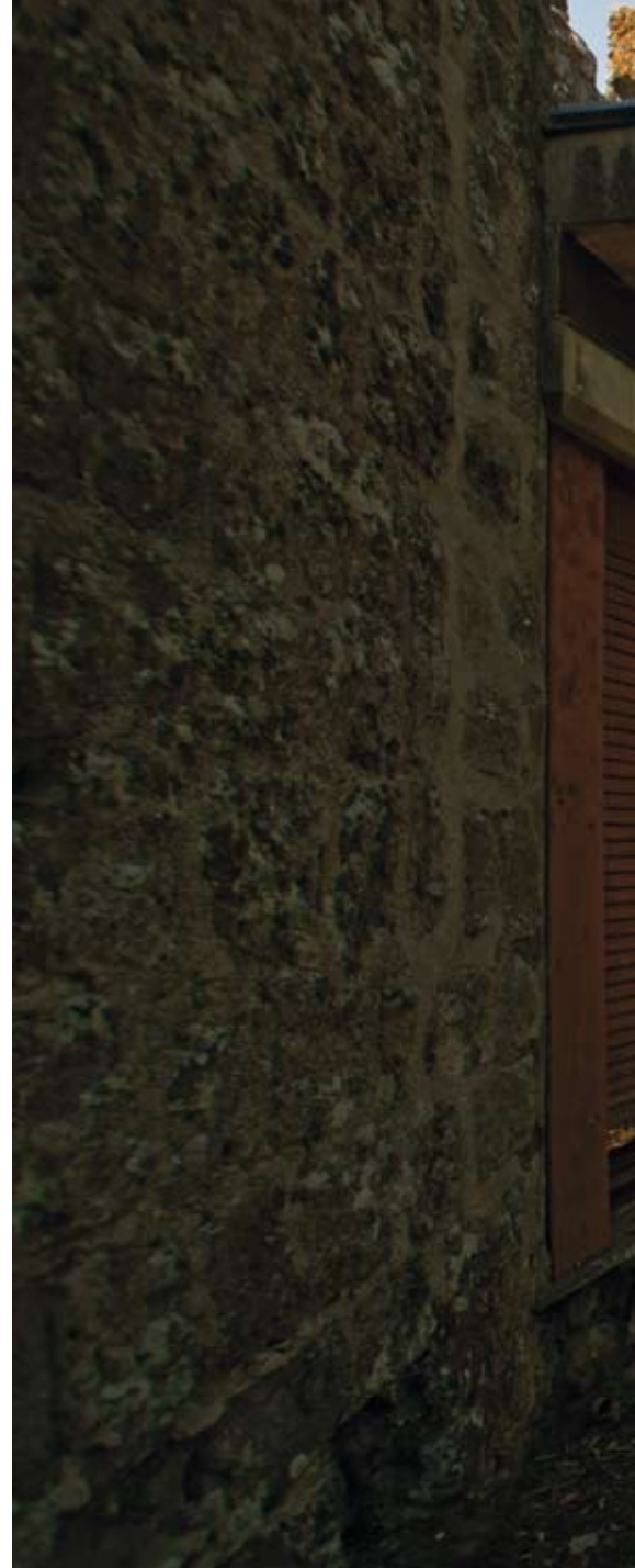
La corte del Castello e l'ala ovest della casa