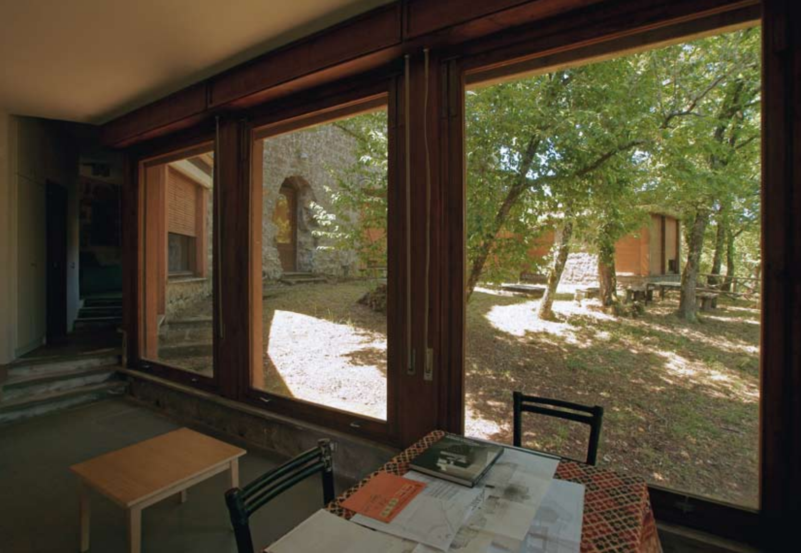
Lo studio di Pasolini nell'ala est ed il soggiorno nell'ala ovest