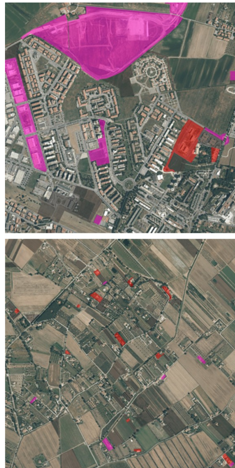
Fig. 3 – In blu esempi di processi di pianificazione attuativa, in rosso esempi di intervento diretto.

In sintesi, è possibile constatare come, interventi dalle dimensioni contenute siano tipicamente riferibili all'utilizzo dell'istituto dell'intervento diretto, mentre aree di