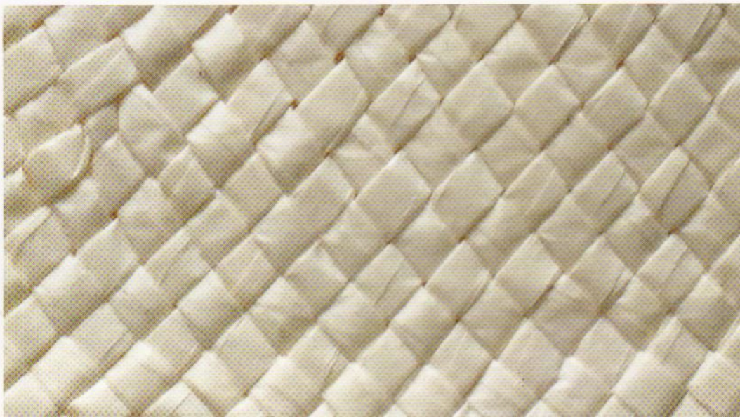
Un intreccio in panama di carta.

Sia nel caso dei prodotti Puma sia nella T-shirt usa e getta , se pur non è possibile parlare di carta tuttavia è da evidenziare che la composizione di gran parte delle fibre impiegate è sempre di cellulosa; oltre a questo, è la modalità di consumo a richiamarci il prodotto carta vero e proprio. Vanno ricordati, poi, gli abiti tecnici ad uso sanitario o di protezione da agenti chimici, i quali, a differenza dei precedenti, pur essendo identificati come vestiti di carta, hanno una com-