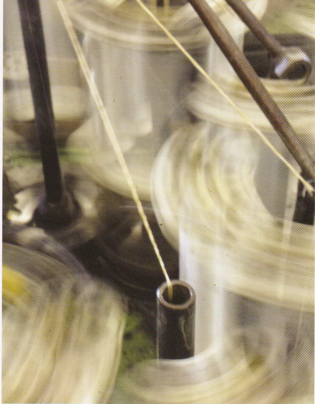
Una fase della lavorazione delle trecce di carta. A paper weave processing phase.

paper clothes also found their place. In this regard, the most curious example that we can give is perhaps that of Hallmark with its slogan "a new paper dress with a party to match" that proposed matching paper clothes, plates and napkins.