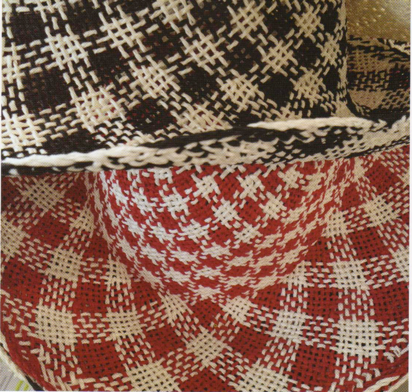
Cappelli in carta colorata intrecciata della ditta Grevi, Firenze.

Hats in coloured paper weave by Grevi, Florence.