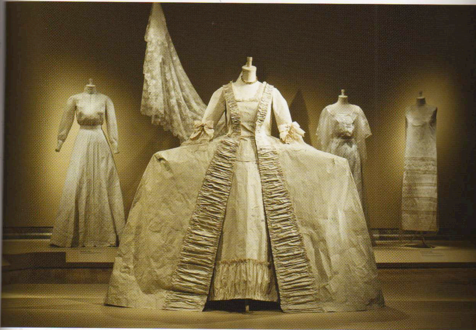
Abiti in carta realizzati da Isabelle de Borchgrave.