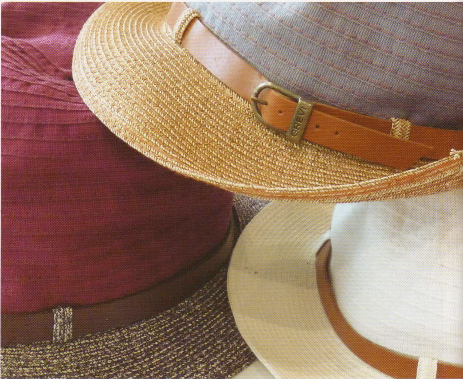
Cappelli in grosgrain e carta della ditta Grevi, Firenze. Hats in grosgrain and paper by Grevi, Florence.

and masks in which the functional aspect seems to be the only factor to be considered. The use of paper in clothing and fashion accessories also follows another path, which is perhaps less ostentatious than what has been illustrated thus far, but certainly no less interesting. This is the use of paper in a spun and woven form. Our research finds two main reasons for this development; one is imitative and the other innovatively aesthetic. The use of the paper to generate weaves, in these cases, does not see the prevalence of shortening of the life cycle of the product or of an important reduction in costs. Rather, there is a general focus on