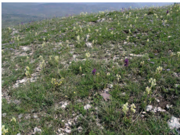
Prateria montana con fioritura di orchidee presso Monte Bazzano (AQ)