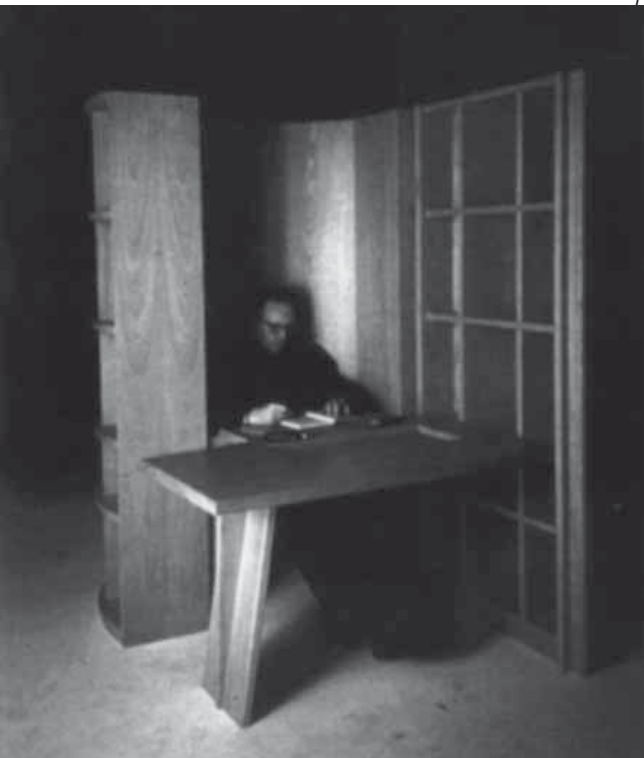
1 Edoardo Detti Recupero di un complesso colonico di proprietà Ronchi Abbozzo, Firenze (1960-67) La nuova scala Archivio di Stato di Firenze Fondo Edoardo Detti 2 Adolfo Natalini Stanza di legno