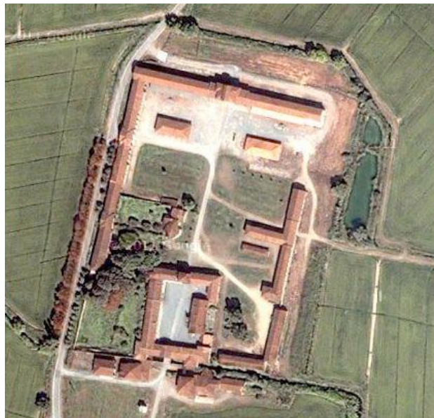
Figura 3. . La grangia di Darola è un insediamento agricolo tuttora attivo, la cui conformazione edilizia obbedisce alle regole della villa fructuaria romana.