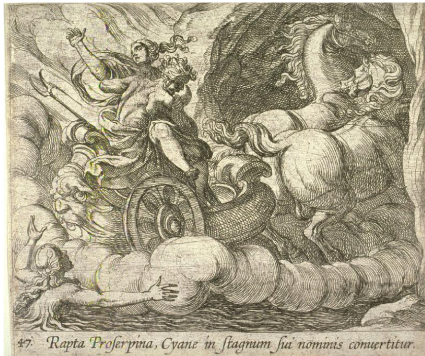
Fig. 3. A. Tempesta, Ratto di Proserpina