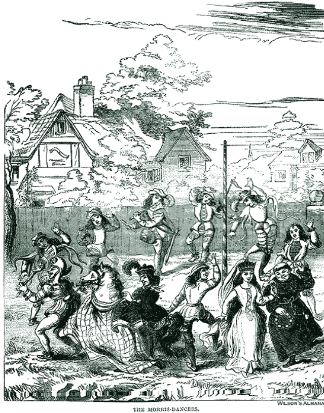
Fig. 5. Morris dance a Pentecoste (da R. Chambers, The book of days , 1881)