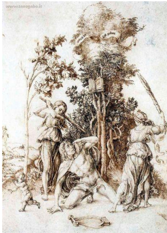
Fig. 1. La morte di Orfeo nell'immagine di Dürer, studiata da Warburg ( Dürer und die italienische Antike , 1905)