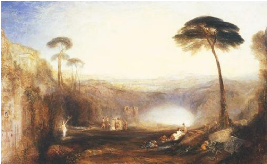
Fig. 7. Turner, Il ramo d'oro (1834)