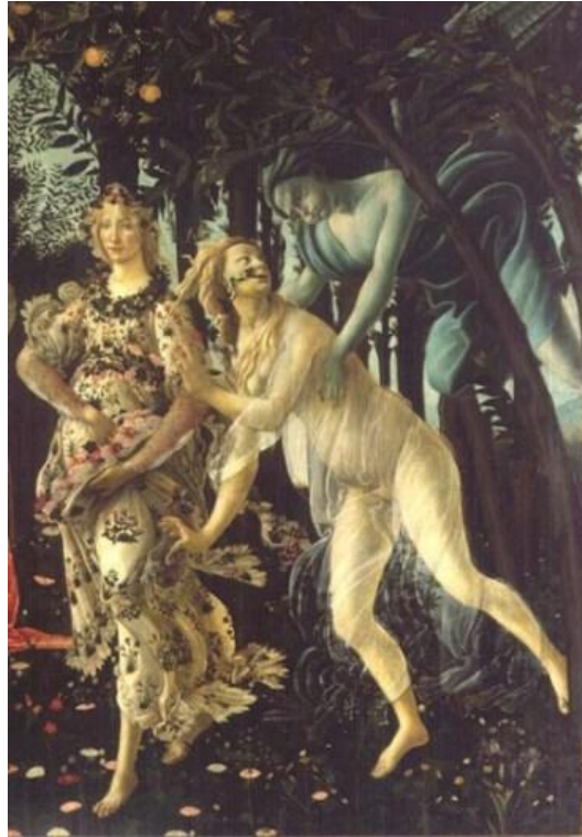
Fig. 2. Zefiro insegue Chloris (part. da Botticelli, La Primavera )