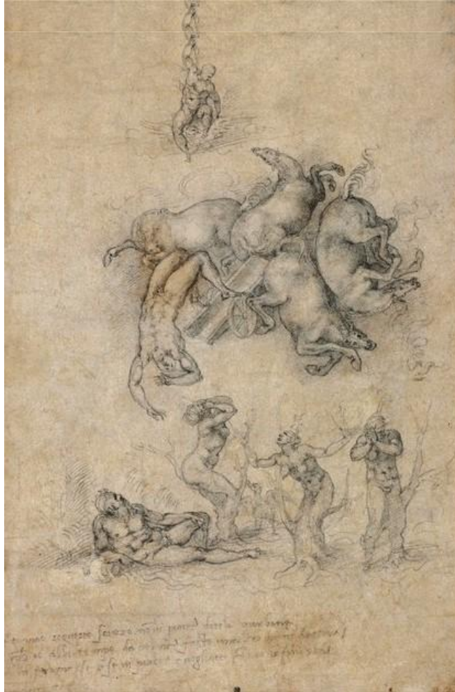
Fig. 12. Michelangelo, La caduta di Fetonte (1533)