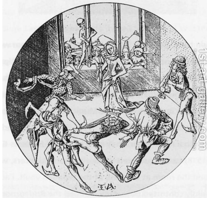
Fig. 6. Morris dance, 1475 (Israhel van Meckenem il giovane)