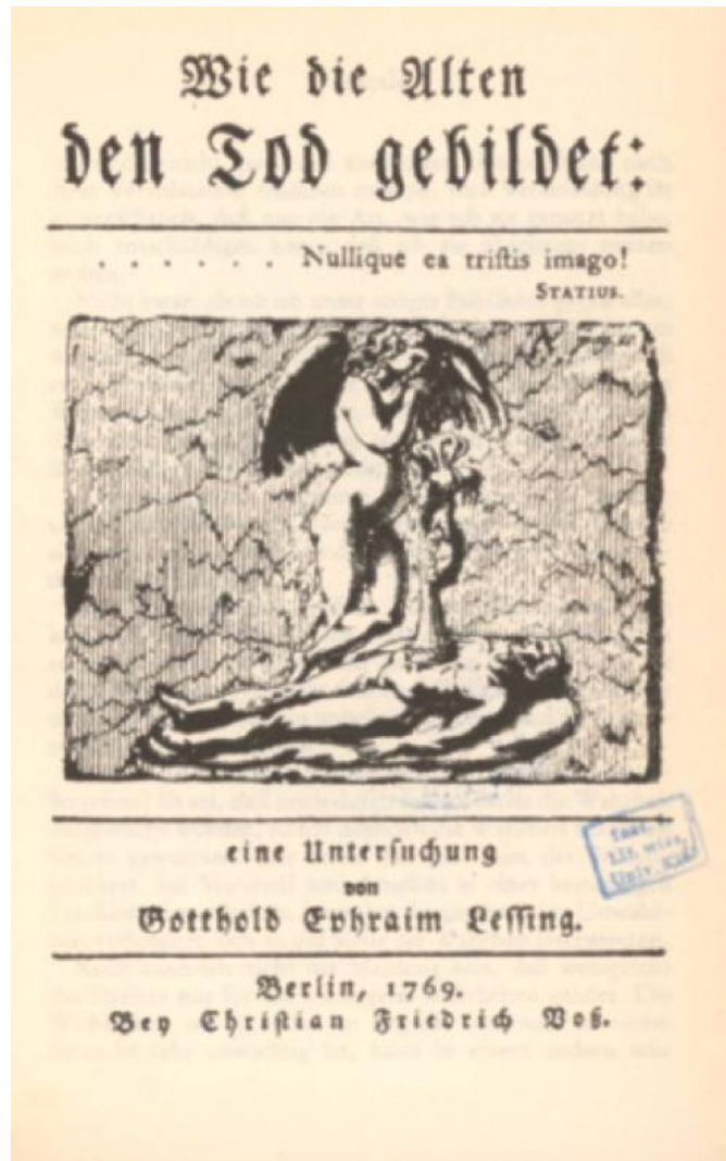
Fig. 9. Lessing, Wie die Alten den Tod gebildet , 1769, frontespizio (part. da un sarcofago con Prometeo, Roma, Campidoglio)