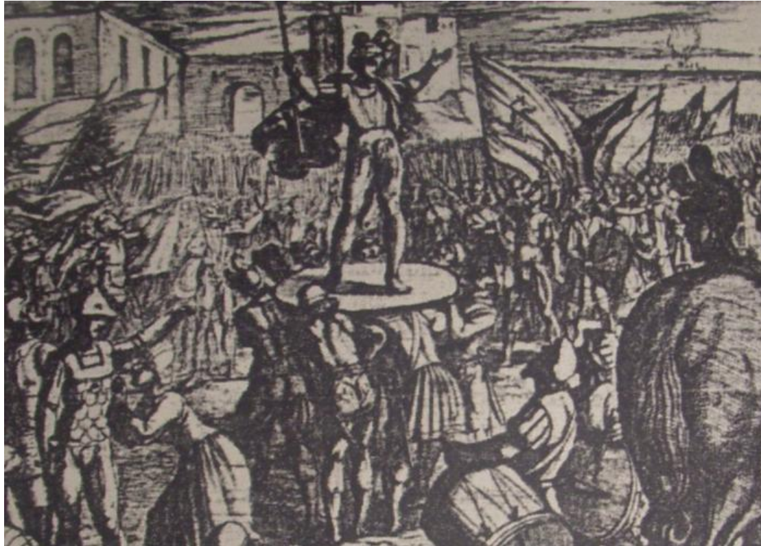
Fig. 4. A. Tempesta, Brinnone innalzato sugli scudi