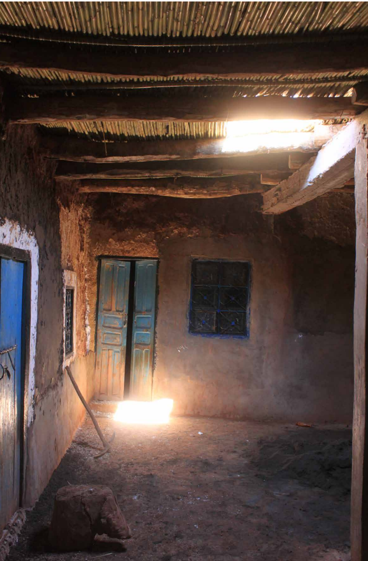
Corte interna di una casa tradizionale Cour d'une maison traditionnelle