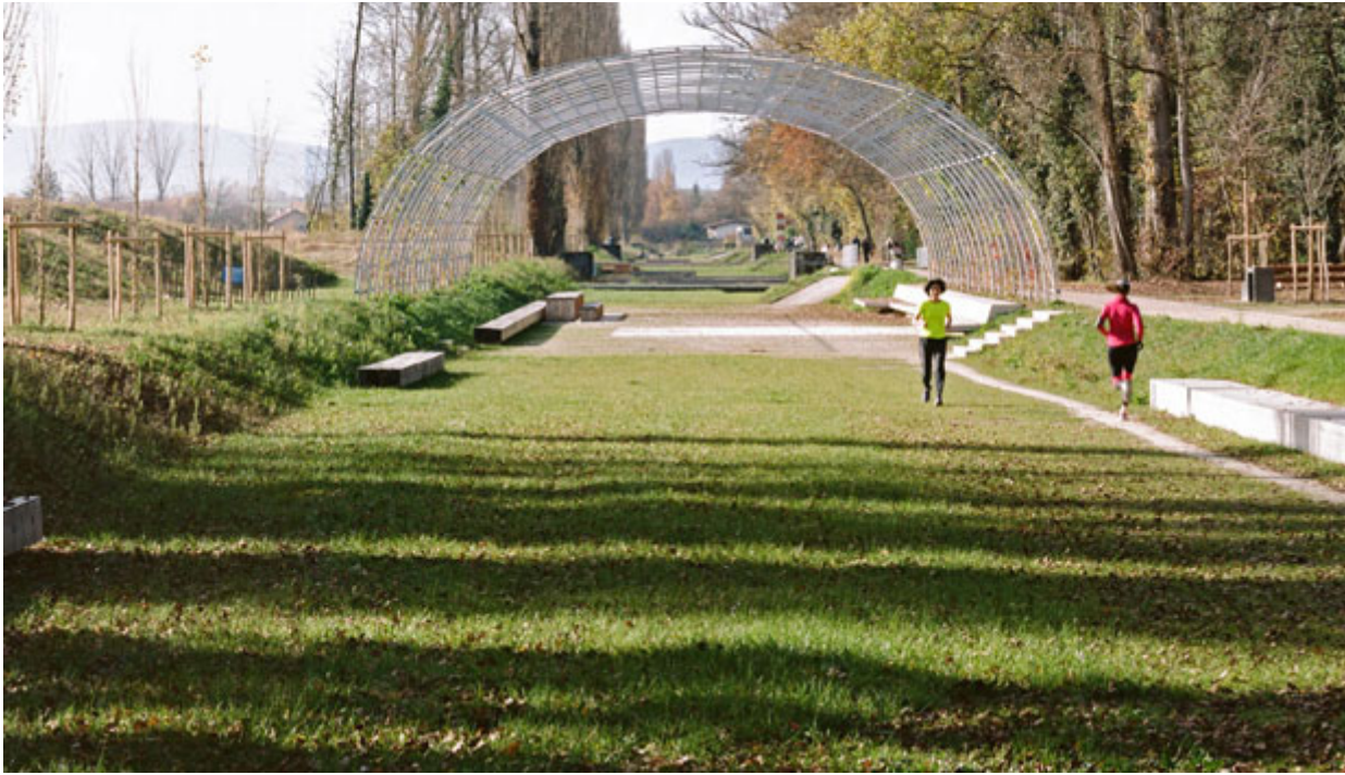
↑ La pergola ricavata lungo il sedime del vecchio canale.

La realizzazione del nuovo alveo del fiume si è svolta in due fasi, dopo averne stabilito le dimensioni ottimali e definito alcune aree di golena per controllare le piene. Nella prima fase i progettisti hanno scavato l'area dove avrebbe dovuto scorrere l'Aire, prevedendo di lasciare al fiume il compito di ricavarsi il proprio percorso, ma il processo avrebbe richiesto troppo tempo. Si è resa quindi necessaria una seconda fase, nella quale i progettisti hanno introdotto un ingegnoso pattern a losanghe, ottenuto scavando il terreno per formare dei canali, attraverso i quali è stata fatta scorrere l'acqua, che così ha potuto rapidamente definire il proprio alveo grazie al materiale eroso passando fra le losanghe. Il risultato assomiglia a un'opera di land art dove