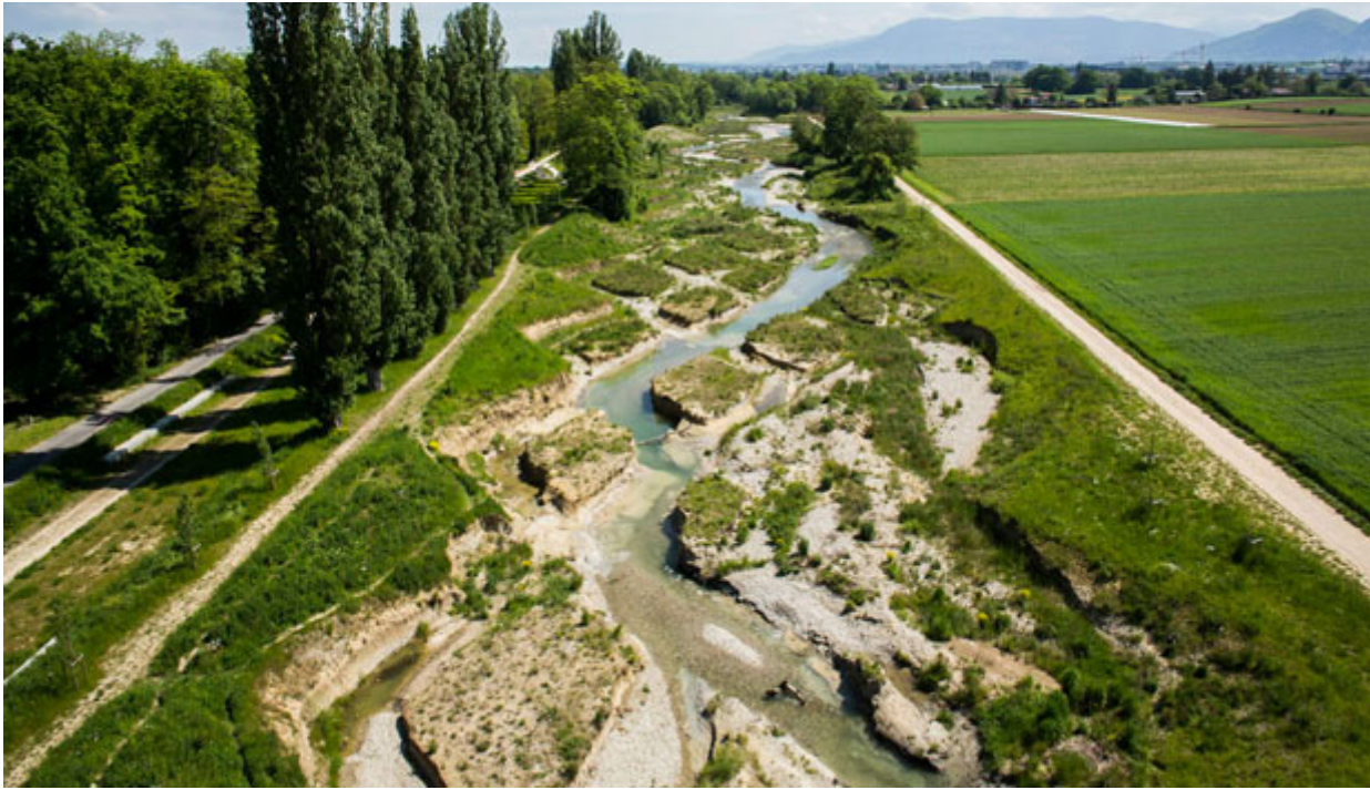
↑ Vista del nuovo alveo del fiume così come è stato generato grazie all'azione erosiva dell'Aire a partire dal disegno a losanghe imposto dai progettisti.

Quest'ultimo, la cui profondità è stata ridotta per la maggior parte del suo sedime da tre metri a uno, è stato trasformato in quello che i progettisti hanno chiamato "giardino sperimentale". Qui, nel dispiegarsi del suo percorso, che si relaziona con la promenade preesistente lungo i vecchi argini, si trovano giardini d'acqua, panchine e tavoli. Una pergola per soste ed eventi corre parallela a "dune" che consentono di leggere l'intervento dall'alto e riproducono le sagome delle montagne in lontananza, per coinvolgerle con la strategia del borrowed landscape .