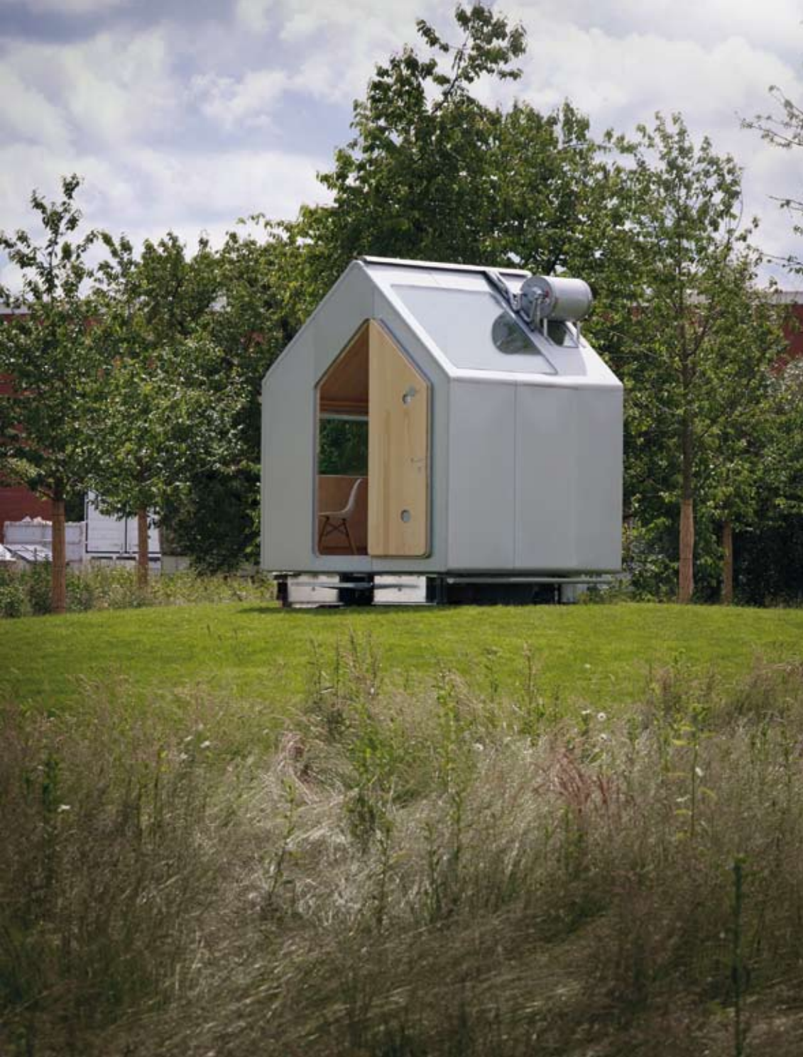
Renzo Piano, Diogene al Vitra Campus, Weil am Rhein