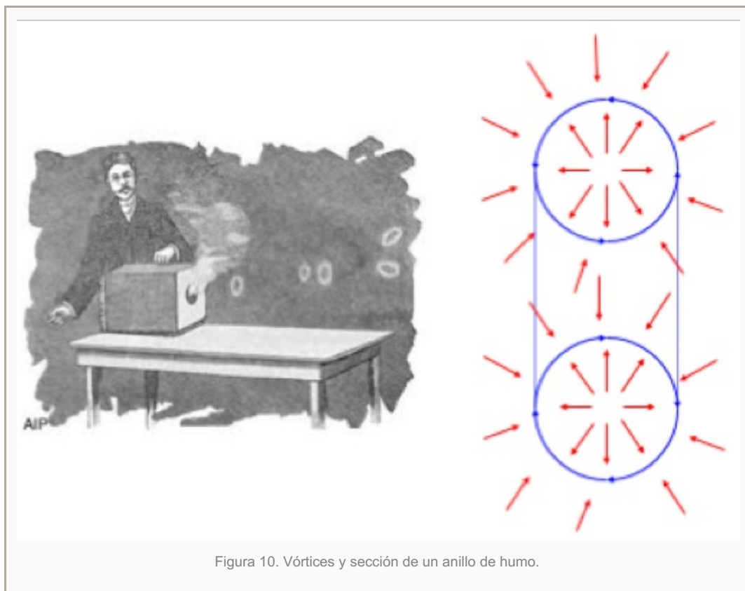
Figura 10. Vórtices y sección de un anillo de humo.

Obviamente (y por desgracia) no se puede transformar la enseñanza de la física en un espectáculo de magia, pero ciertamente no estaría mal si los maestros aprenden al menos algún elemento de teatralidad (que todavía me falta) con una construcción narrativa. Tal vez así no estaríamos tan carentes de graduados en temas de ciencia e ingeniería. C^2