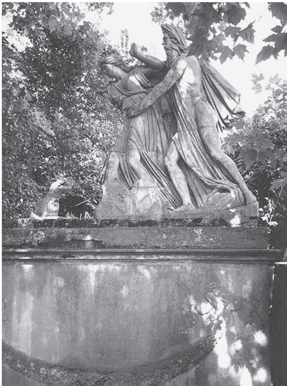
Fig. 6: La statua di Ambra insidiata da Ombrone nel parco della Villa Medicea di Poggio a Caiano