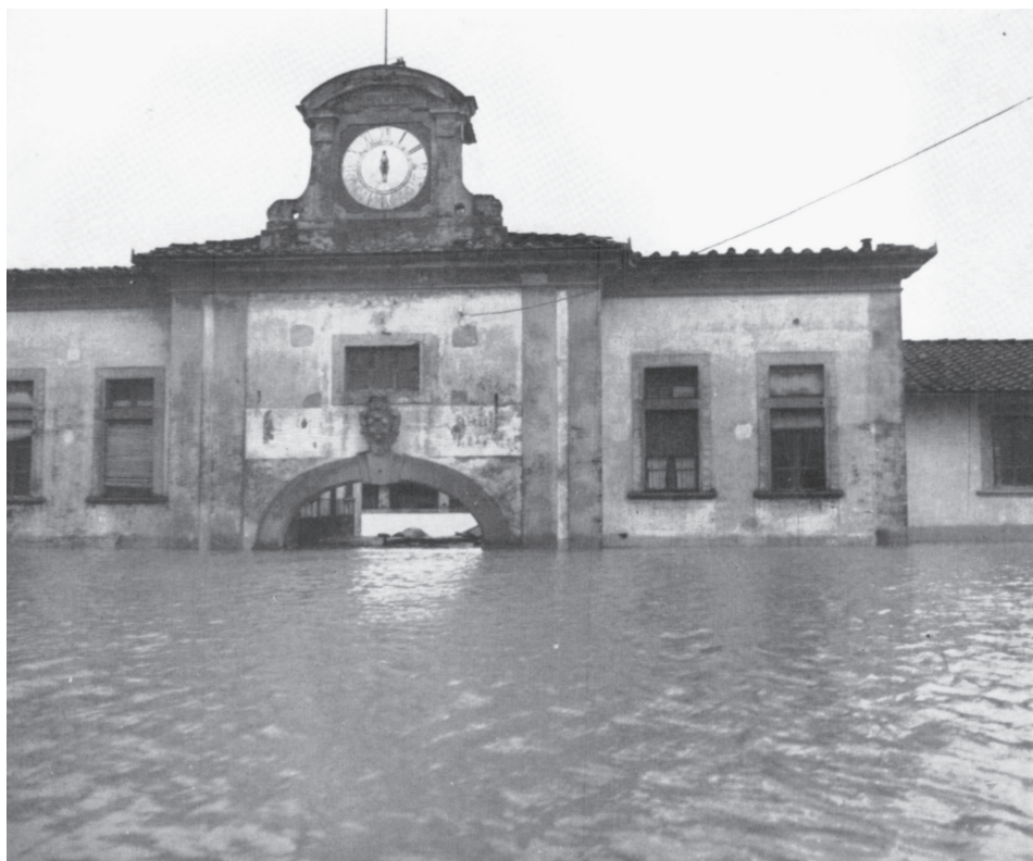
Fig. 4: La Fattoria laurenziana al tempo dell'alluvione del 1966.