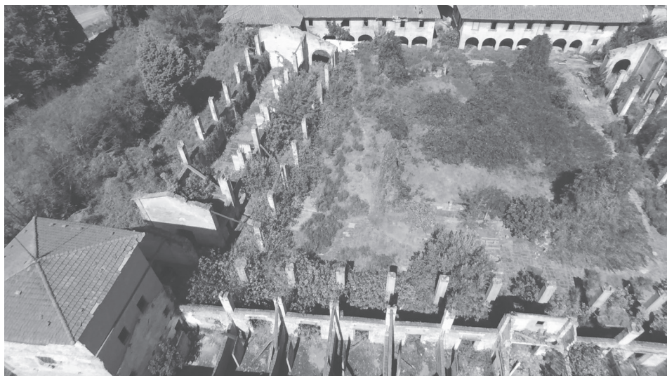
Fig. 3: La Fattoria laurenziana allo stato attuale.