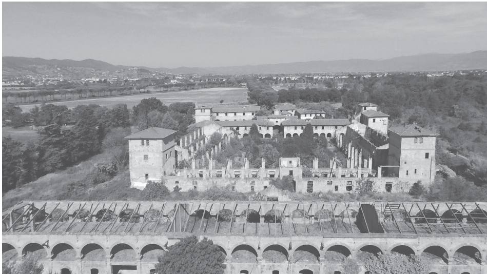
Fig. 2: La Fattoria laurenziana allo stato attuale.