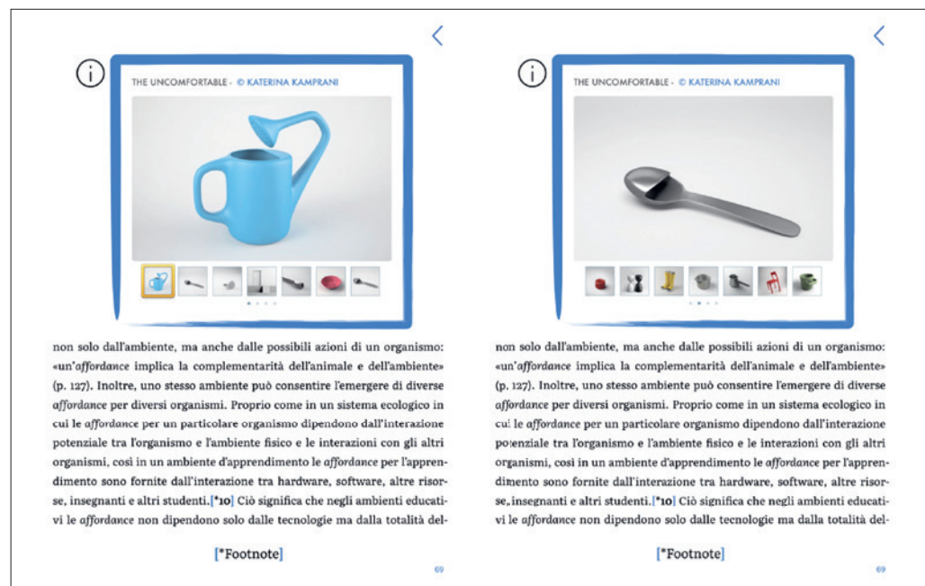
Fig. 3 Galleria fotografica interattiva dedicata alla serie «The Uncomfortable» ( https://www.theuncomfortable.com/ ) della designer Katerina Kamprani utile alla spiegazione del concetto di affordance.