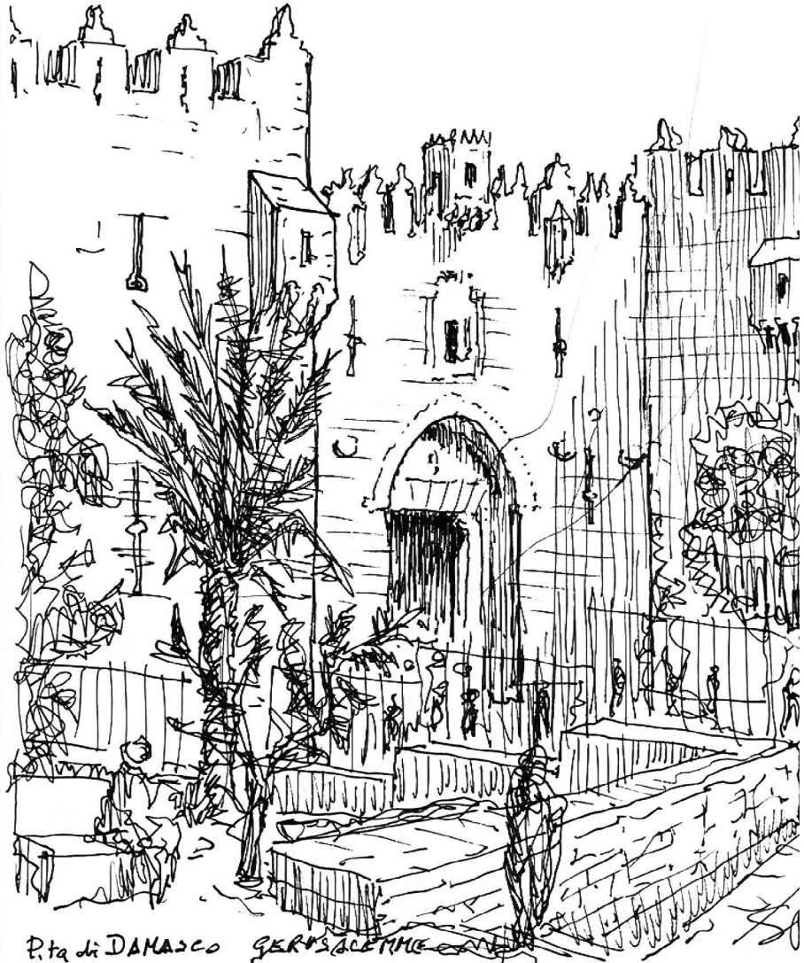
P.ta di DAMASCO GERUSALEMME